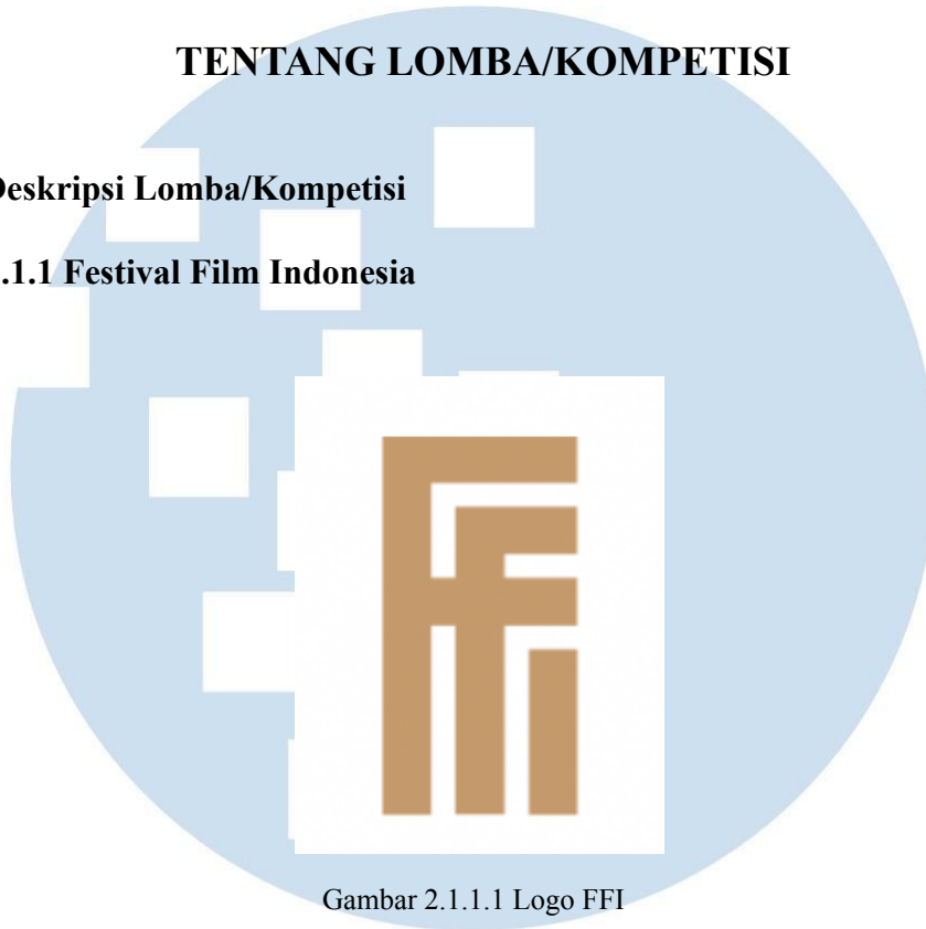
Gambar 2.1.1.1 Logo FFI