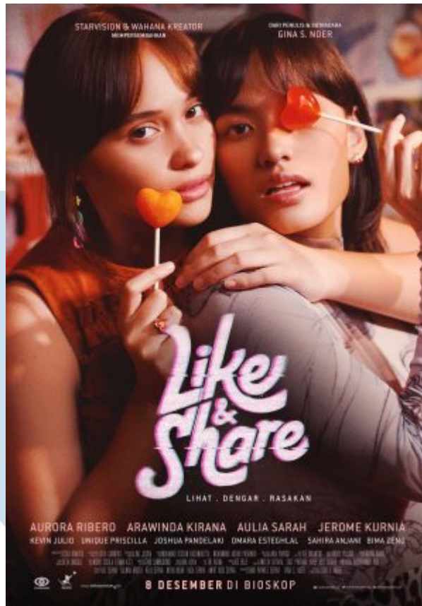
Gambar 2.3.1 Portfolio JAFF