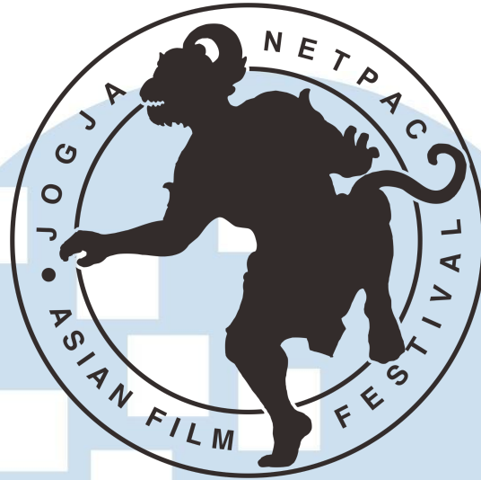
Gambar 2.1.1.2 Logo JAFF