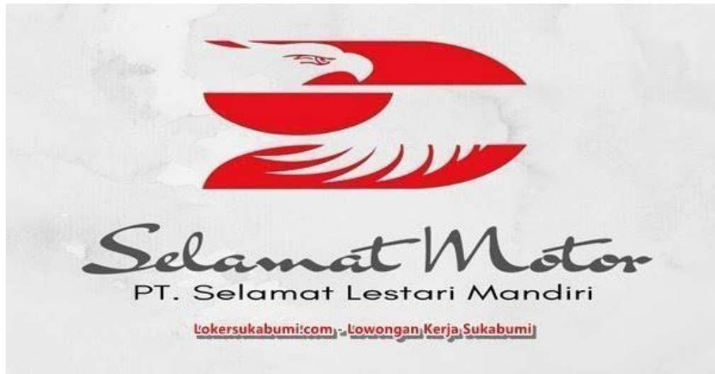
Gambar 2.1 PT. Selamat Lestari Mandiri Sukabumi