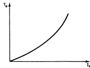
Gambar 1. Hubungan karakteristik torsi dan arus jangkar pada motor DC seri

Sehingga berdasarkan persamaan 2, torsi memiliki hubungan dengan kuadrat arus jangkar, seperti yang ditunjukkan pada gambar 1.