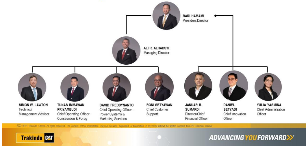
Gambar 2. 2 Bagan Struktur PT. Trakindo Utama