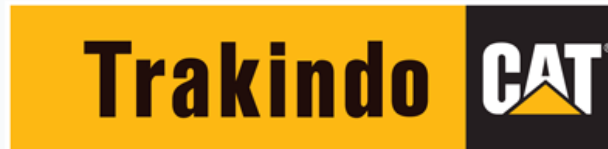
Gambar 2. 1 Gambar Logo Perusahaan PT.Trakindo Utama

Gambar 2.1 diatas menampilkan sebuah gambar logo dari PT Trakindo Utama (Trakindo), “Dengan komposisi warna “Hitam,Putih, & Kuning”, PT. Trakindo Utama sendiri telah berkembang selama lebih dari 40 tahun, merupakan anak perusahaan dari PT Tiara Marga Trakindo (TMT) yang didirikan pada tanggal 23 Desember 1970 oleh AHK "Met" Hamami.