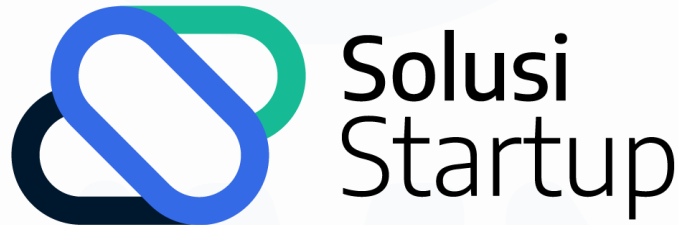
Gambar 2. 1 Logo PT Solusi Startup Indonesia

PT Solusi Startup Indonesia atau dikenal dengan SekolahStartup merupakan perusahaan yang bertujuan untuk membantu startup founder yang ingin memulai membangun startup dengan cara memberikan layanan online course . Perusahaan PT Solusi Startup Indonesia sendiri didirikan oleh Bapak Fadli Wilihandarwo di tahun 2020 dengan nama SekolahStartup dengan kantor pusat di Graha Savantara, JL Anthurium No 1 Dusun Banjarsari, Kabupaten Sleman, Yogyakarta. PT Solusi Startup Indonesia juga memiliki website https://www.sekolahstartup.com agar para startup founder pemula dapat mengakses online course dan juga terdapat informasi lainnya seperti kurikulum, serta harga course yang ditawarkan.