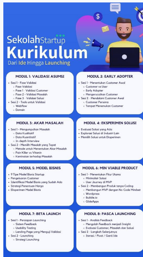
Gambar 2. 2 Kurikulum Pembelajaran di SekolahStartup

sehingga dapat menciptakan dan mengembangkan produk untuk startup para founder tersebut.