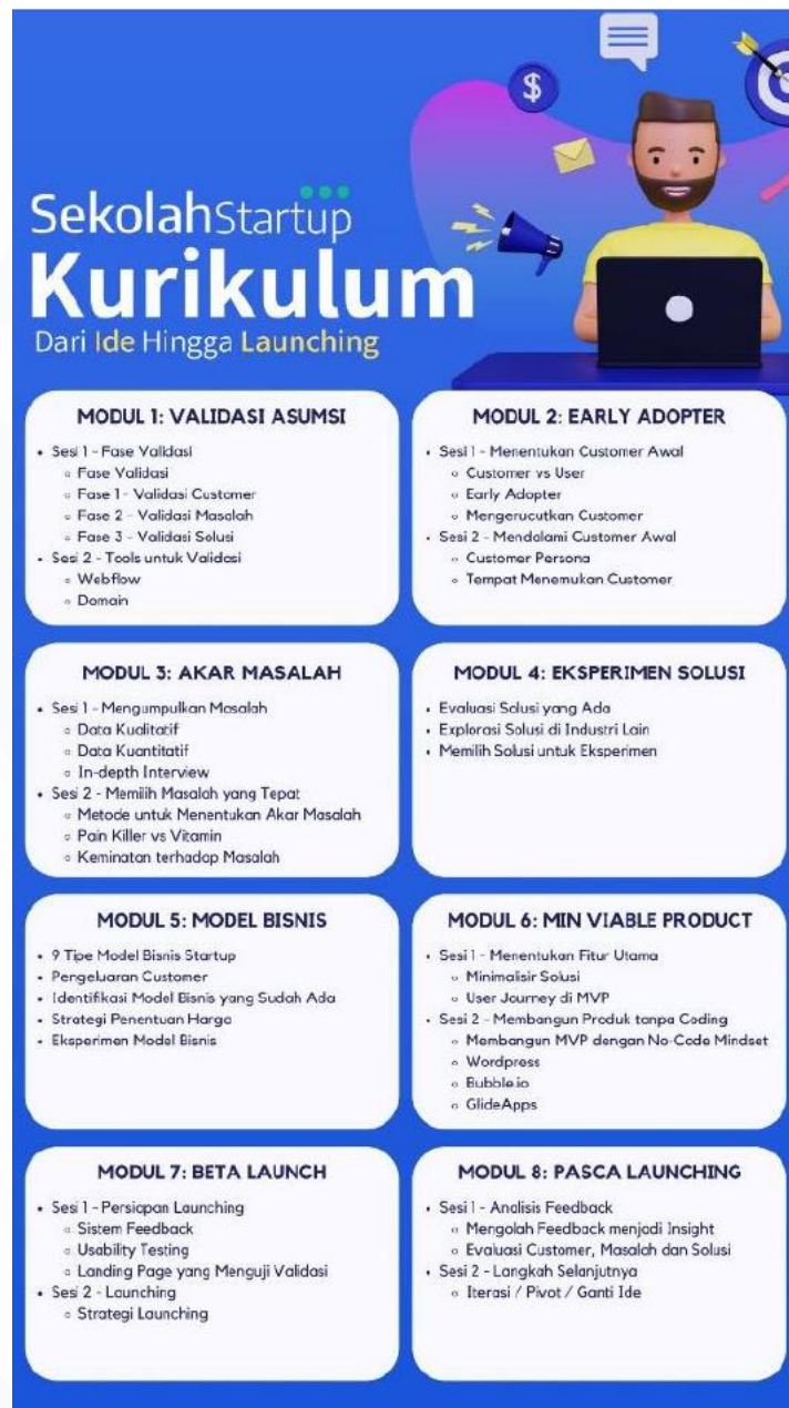
Gambar 1.4 Kurikulum Online Course Sekolah Startup

Gambar 1.4 menunjukkan kurikulum online course yang dimiliki oleh Sekolah Startup. Sekolah Startup menyediakan berbagai macam program pelatihan, workshop , dan acara edukasi lainnya yang dirancang untuk memperkenalkan konsep dan praktik wirausaha dan teknologi kepada peserta. SekolahStartup juga bekerja sama dengan berbagai pihak seperti, universitas,