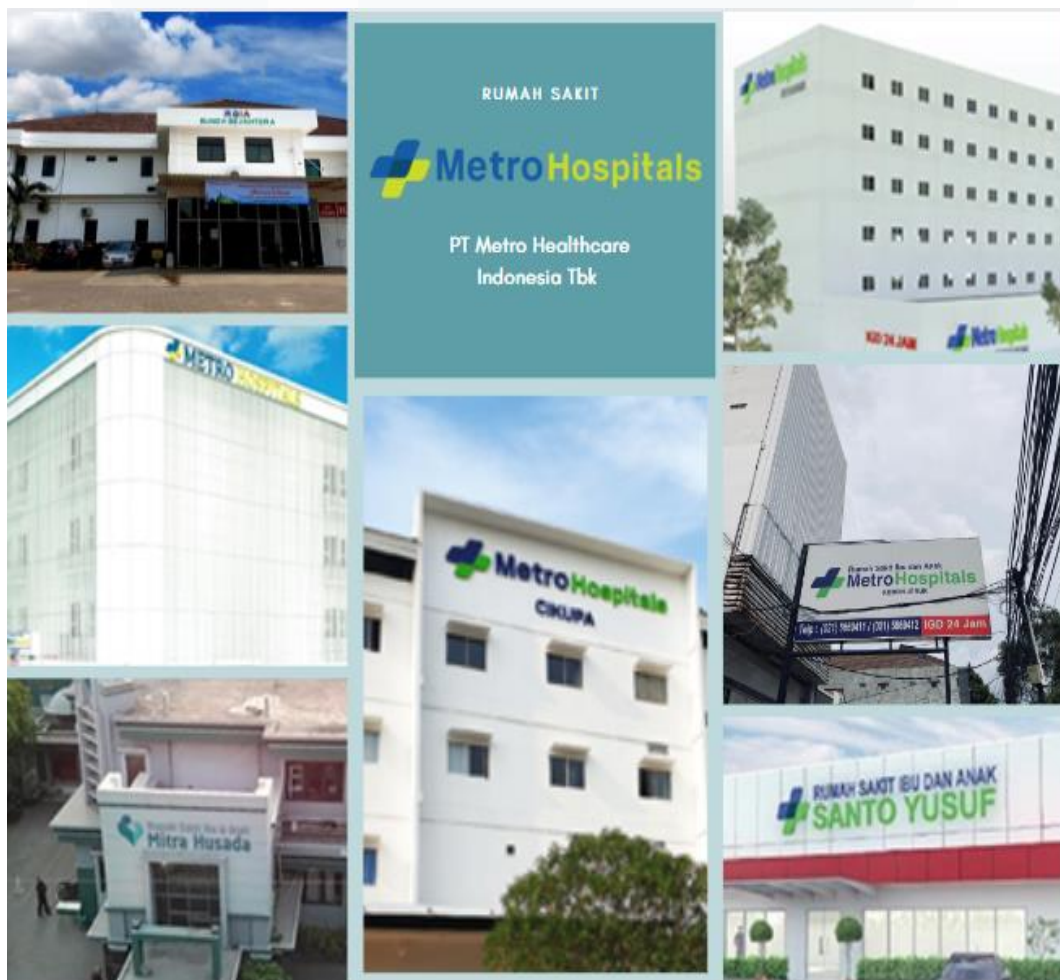
Gambar 2. 2 Rumah Sakit Metro Hospitals Group

Tidak hanya rumah sakit PT Metro Healthcare Indonesia Tbk mempunyai rencana untuk mengembangkan usaha di bidang teknologi layanan Kesehatan dengan tujuan akan memudahkan masyarakat dalam menggunakan atau mendapatkan layanan Kesehatan maupun secara online dan secara langsung