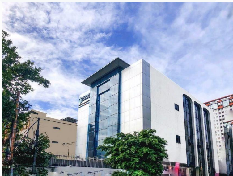
Gambar 2.2 PT. Indolok Bakti Utama Ho Jakarta