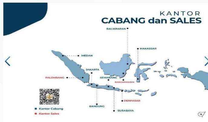
Gambar 2.6 Kantor Cabang Indolok Bakti Utama

Sejak berdirinya PT. Indolok Bakti Utama di tahun 1972, PT. Indolok Bakti Utama mulai melebarkan sayap usahanya dengan membuat kantor cabang. Hingga saat ini, PT. Indolok Bakti Utama memiliki 5 cabang yang tersebar di seluruh Indonesia. Kantor cabang yang dimiliki PT. Indolok Bakti Utama yaitu terletak di Medan, Semarang, Bandung, Surabaya, Makassar.