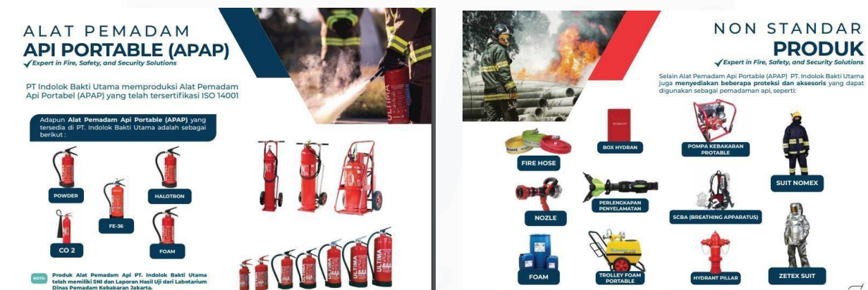
Gambar 2.9 Produk fire yang dimiliki PT. Indolok Bakti Utama

Selain itu, dalam memasarkan bisnis nya PT. Indolok Bakti Utama menyediakan bisnis online bagi para customer yang ingin melakukan pemesanan secara online dapat mengunjungi website dari PT. Indolok Bakti Utama. Di dalam website tersebut terhubung dengan e-commerce yang menyediakan produk produk dari PT. Indolok Bakti Utama.