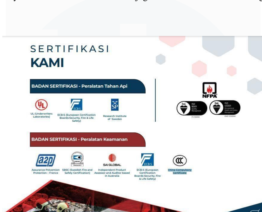
Gambar 2.7 Sertifikasi yang di miliki PT. Indolok Bakti Utama

dan China Compulsory Certificate . Sertifikasi tidak hanya di miliki perusahaan, tetapi karyawan PT. Indolok Bakti Utama juga memiliki sertifikasi di bidangnya.