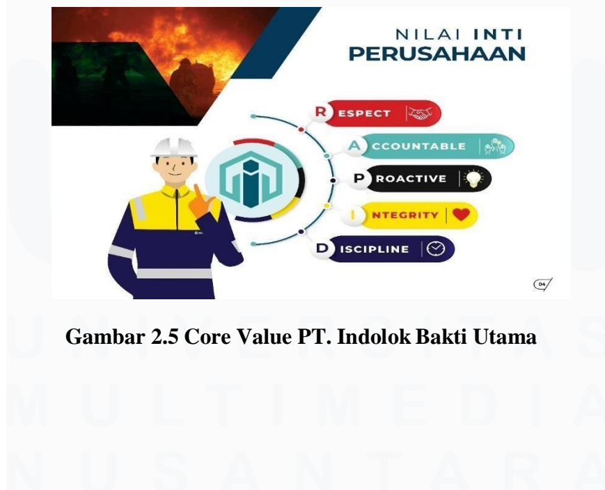
Gambar 2.5 Core Value PT. Indolok Bakti Utama

PT. Indolok Bakti Utama memiliki core value yang disingkat menjadi RAPID. Core value PT. Indolok Bakti Utama yaitu RAPID terdiri dari Respect, Accountable Proactive, Integrity, dan Discipline.