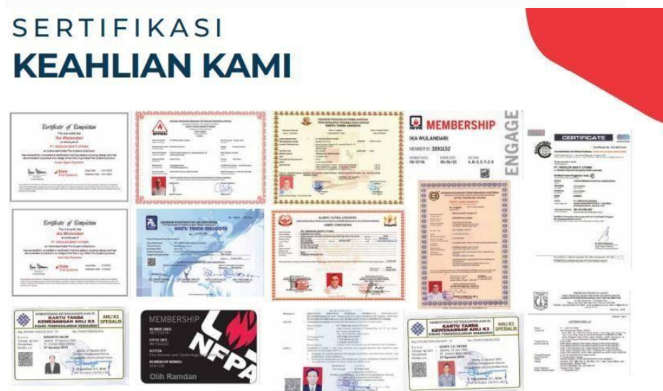
Gambar 2.8 Sertifikasi keahlian karyawan PT. Indolok Bakti Utama