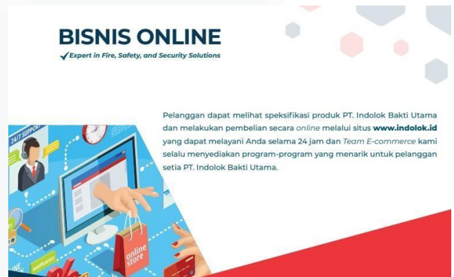
Gambar 2.10 Service business yang di miliki PT. Indolok Bakti Utama