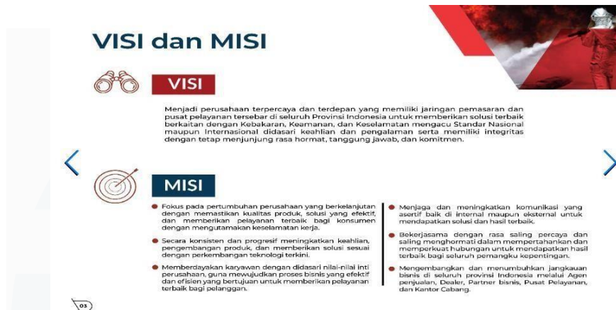
Gambar 2.4 Visi Misi PT. Indolok Bakti Utama