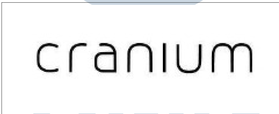
Gambar 2.1. Logo Cranium

Didirikan pada tahun 2009, PT Cranium Royal Aditama awalnya fokus pada bisnis desain merek dengan proses cetak, namun pada tahun 2013 perusahaan mulai memperluas bisnisnya dengan menciptakan aplikasi dan situs web. Cranium berdiri sendiri pada tahun 2014 dan mendirikan PT Cranium Royal Aditama pada tahun 2009. Berawal dari bisnis desain branding dengan percetakan, PT Cranium Royal Aditama memulai bisnis produksi aplikasi dan web pada tahun 2013. Pada tahun 2014, Cranium menjadi entitas independen. Pada tahun 2022, BC Card, penyedia solusi pembayaran asal Korea Selatan, telah mengakuisisi 67% saham Cranium Indonesia. Langkah ini merupakan bagian dari strategi ekspansi BC Card di pasar Asia Tenggara, dan bertujuan untuk memanfaatkan potensi pertumbuhan layanan TI global.