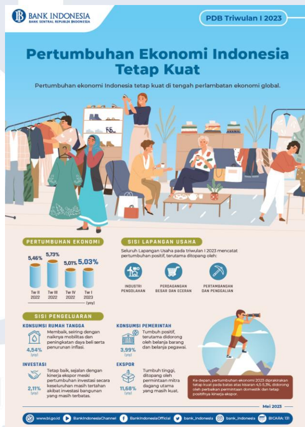
Gambar 1.1 Pertumbuhan Ekonomi Indonesia pada Triwulan I 2023

Pertumbuhan ekonomi Indonesia masih kuat di tengah perlambatan ekonomi global. Menurut data dari Badan Pusat Statistik, pertumbuhan ekonomi Indonesia pada triwulan I tahun 2023 tercatat sebesar 5,03% (yoy), sedikit lebih tinggi dari pertumbuhan pada triwulan sebelumnya sebesar 5,01% pada triwulan sebelumnya. Pertumbuhan ekonomi kedepannya diperkirakan akan tetap kuat (Bank Indonesia, 2023).