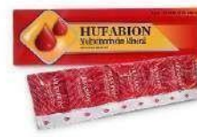
HUFABION Kapsul Anti Anemia