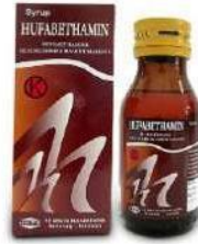
HUFABETHAMIN Syrup Kortikosteroid