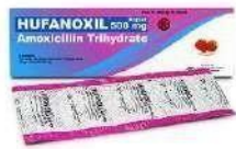
HUFANOXIL Kaplet Antibiotika