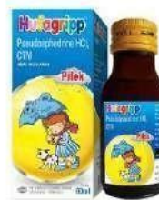
HUFAGRIPP Pilek Syrup Anti Influenza