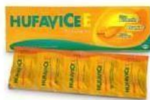
HUFAYICE Kaplet Multivitamin dan Mineral