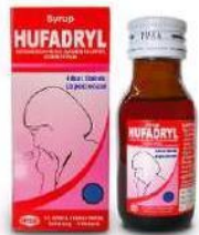
HUFADRYL EXPECTORANT Syrup Obat Batuk