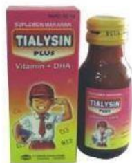
TIALYSIN PLUS Suspensi Multivitamin dan Mineral