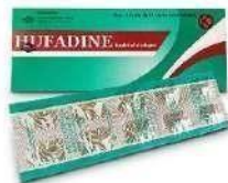
HUFADINE Kaplet Antasida (Obat Saluran Cerna)