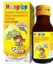
HUFAGRIPP Flu & Batuk... Anti Influenza