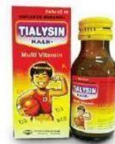
TIALYSIN KALK Suspensi Multivitamin dan Mineral