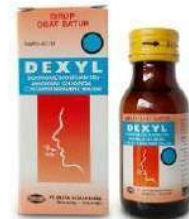
DEXYL Syrup Obat Batuk