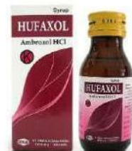
HUFAXOL Syrup Obat Batuk