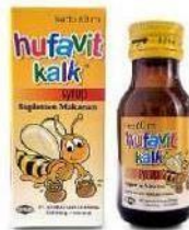
HUFAVIT KALK Suspensi Multivitamin dan Mineral