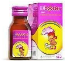
H-Booster Multivitamin dan Mineral