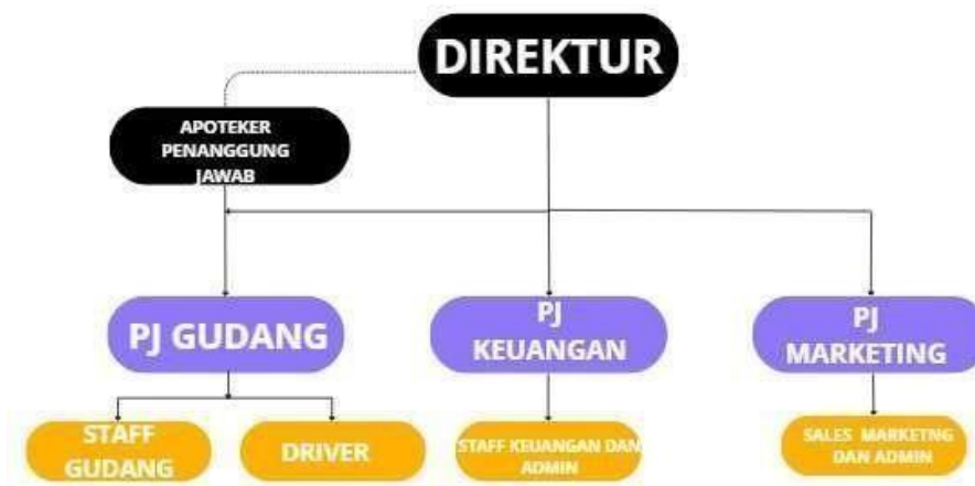
Gambar 2.2 Struktur Organisasi PT Prima Fajar Mandiri

Gambar diatas menunjukkan struktur organisasi kantor manajemen pada PT Prima Fajar Mandiri. Terdapat total 16 karyawan yang bekerja di kantor tersebut. Struktur