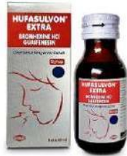
HUFASULVON EXTRA Syrup Obat Batuk