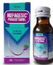
HUFAGESIC 120mg/ 5mL Syrup Analgesik Antipiretik & Anti Inflamasi