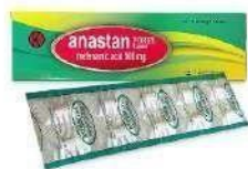
ANASTAN FORTE Kaplet Analgesik Antipiretik & Anti Inflamasi