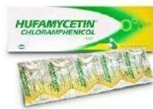
HUFAMYCETIN Kapsul Antibiotika