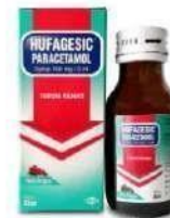
HUFAGESIC 160mg/ 5mL Syrup Analgesik Antipiretik & Anti Inflamasi