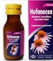
HUFANACEA Syrup Multivitamin dan Mineral