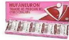
HUFANEURON Kaplet Multivitamin dan Mineral