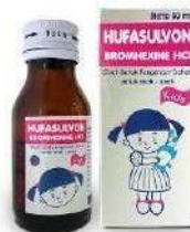
HUFASULVON KIDS Syrup Obat Batuk