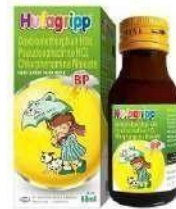
HUFAGRIPP BP Syrup Anti Influenza