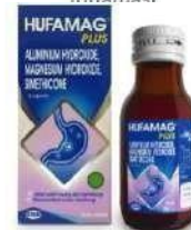
HUFAMAG PLUS Suspensi Antasida (Obat Saluran Cerna)