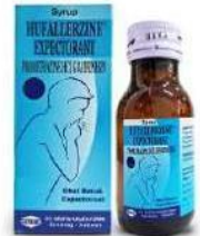
HUFALLERZINE Syrup Obat Batuk