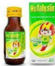
HUFALYSIN Syrup Multivitamin dan Mineral