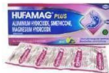
HUFAMAG PLUS Tablet (BOX) Antasida (Obat Saluran Cerna)