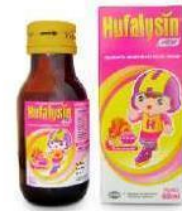
HUFALYSIN NEW Suspensi Multivitamin dan Mineral