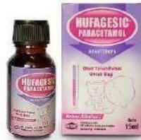
HUFAGESIC INFANT DROPS Analgesik Antipiretik & Anti Inflamasi