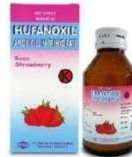
HUFANOXIL DRY Syrup Antibiotika