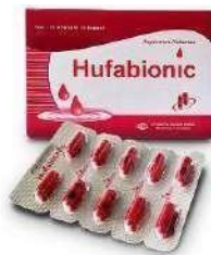
HUFABIONIC Kapsul Anti Anemia