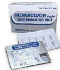
HUFASULVON Kaplet Obat Batuk