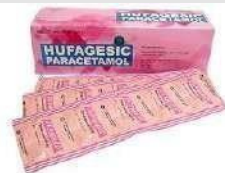
HUFAGESIC Kaplet Analgesik Antipiretik & Anti Inflamasi