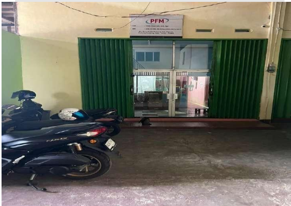
Gambar 2.1 Lokasi perusahaan

Jl Baru Solok Batuang RT 01 Kel. Sigando Padang Panjang