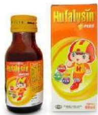
HUFALYSIN PLUS Suspensi Multivitamin dan Mineral