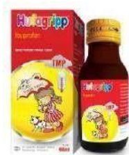
HUFAGRIPP TMP Suspensi Analgesik Antipiretik & Anti Inflamasi