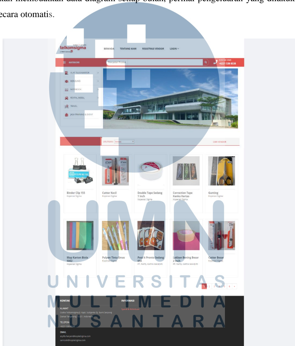
Gambar 2.5. E-Catalog Telkomsigma

pembelanaan lama, maka pada proyek yang dikerjakan ini akan memudahkan pihak Telkom untuk menganalisa pengeluaran yang dilakukan. Dashboard admin merupakan salah satu bentuk nyata dari fitur yang disematkan pada e-catalog telkomsigma. Jika semua pembelian dilakukan melalui sarana ini, maka sistem akan membuat data diagram setiap bulan, perihal pengeluaran yang dilakukan secara otomatis.