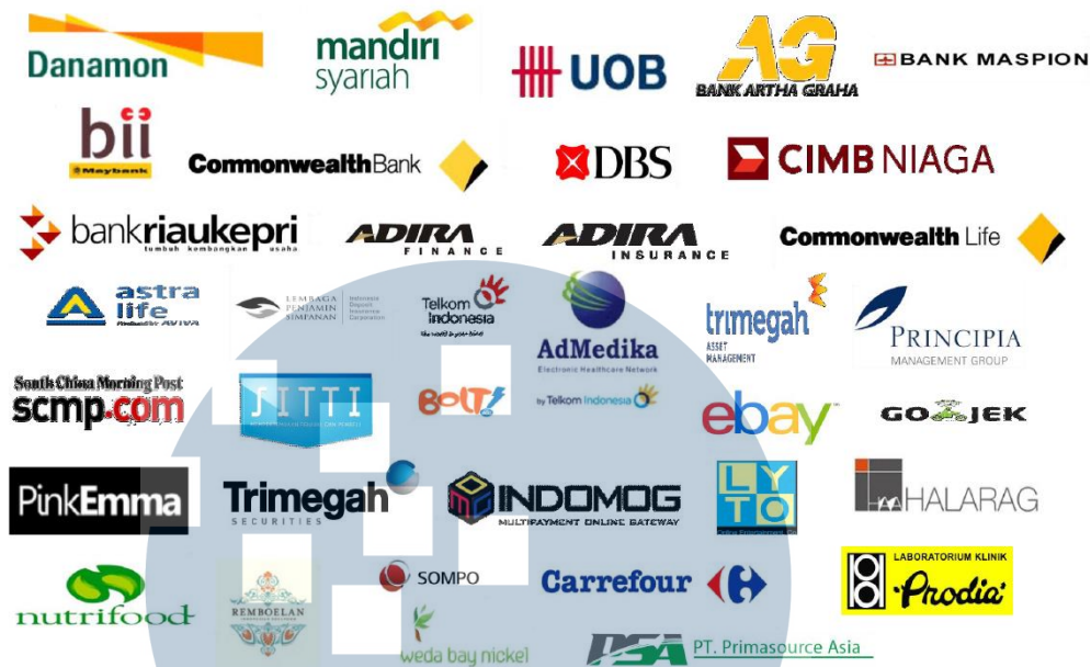
Gambar 2.4. Mitra Bisnis Perusahaan