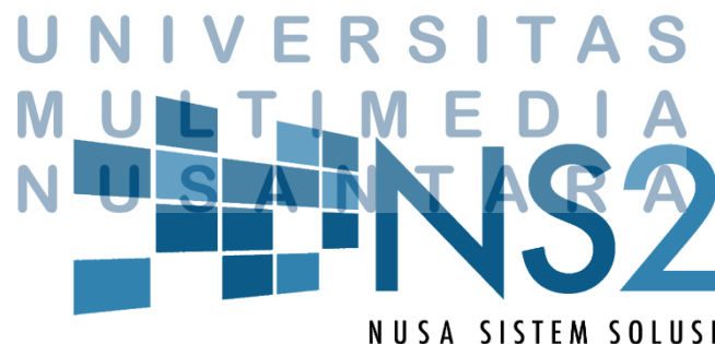
Gambar 2.1. Logo Perusahaan Nusa Sistem Solusi