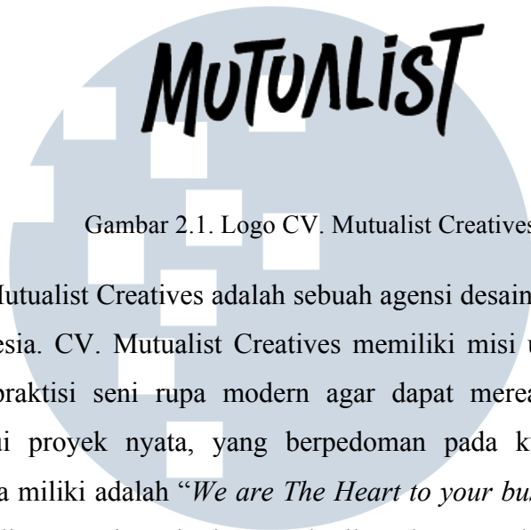
Gambar 2.1. Logo CV. Mutualist Creatives

CV. Mutualist Creatives adalah sebuah agensi desain grafis yang berdiri di Indonesia. CV. Mutualist Creatives memiliki misi untuk menjadi wadah bagi praktisi seni rupa modern agar dapat merealisasikan karya seni melalui proyek nyata, yang berpedoman pada kualitas. Slogan yang mereka miliki adalah “ We are The Heart to your business ”. Dari itu, CV. Mutualist Creatives ingin memberikan karya terbaiknya kepada klien untuk memajukan sebuah produk atau jasa yang sedang dijalankan melalui sebuah desain.