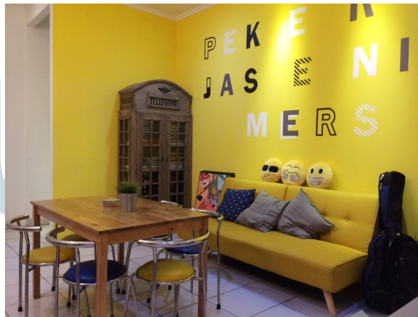
Gambar 2.4. Sisi lain ruang kantor CV. Mutualist Creatives