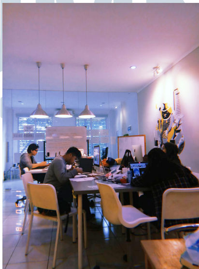
Gambar 2.2. Suasana kantor CV. Mutualist Creatives

CV. Mutualist Creatives adalah sebuah agensi desain grafis yang berdiri di Indonesia. CV. Mutualist Creatives memiliki misi untuk menjadi wadah bagi praktisi seni rupa modern agar dapat merealisasikan karya seni melalui proyek nyata, yang berpedoman pada kualitas. Slogan yang mereka miliki adalah “ We are The Heart to your business ”. Dari itu, CV. Mutualist Creatives ingin memberikan karya terbaiknya kepada klien untuk memajukan sebuah produk atau jasa yang sedang dijalankan melalui sebuah desain.