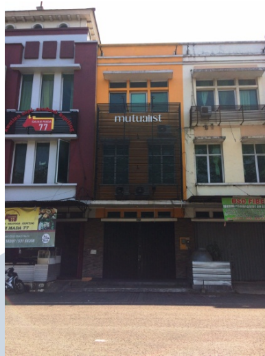
Gambar 2.3. Ruko Kantor CV. Mutualist Creatives