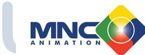
Gambar 2.2. Logo Perusahaan MNC Animation