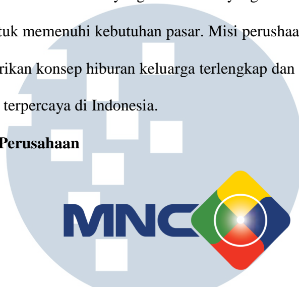
Gambar 2.1. Logo PT Media Nusantara Citra Tbk