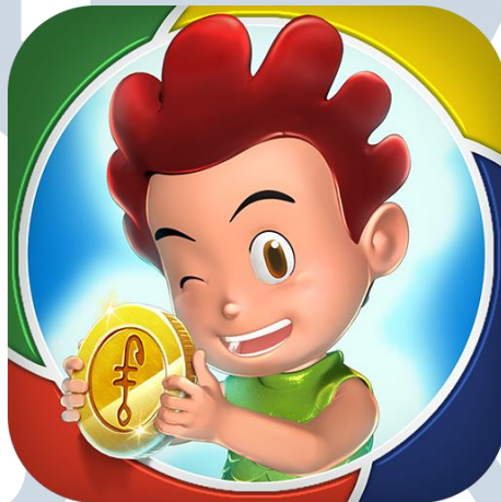
Gambar 2.5. Ikon Aplikasi KIKO Run

Pada saat ini, PT Media Nusantara Citra Tbk MNC Animation – Games Division memiliki satu karya game baru yaitu “KIKO Run”. Game ini berplatform mobile dan memiliki genre endless runner dimana pemain bertahan agar karakternya berlari selama mungkin sambil mengumpulkan koin untuk mendapatkan skor yang tinggi. Game ini memiliki cerita dimana Kiko harus berlari untuk mengejar robot ciptaan Ting Ting yang malfungsi dan mampu untuk menghancurkan kota. Game ini sempat menduduki peringkat ketiga Popular Games pada Google Play Store Indonesia pada minggu ketiga setelah rilis.