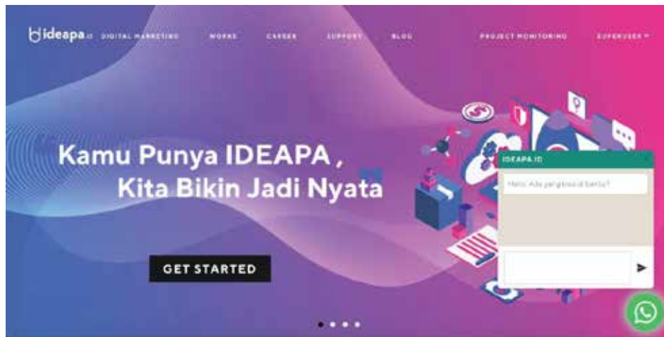
Gambar 2.2. Halaman Home Ideapa.id