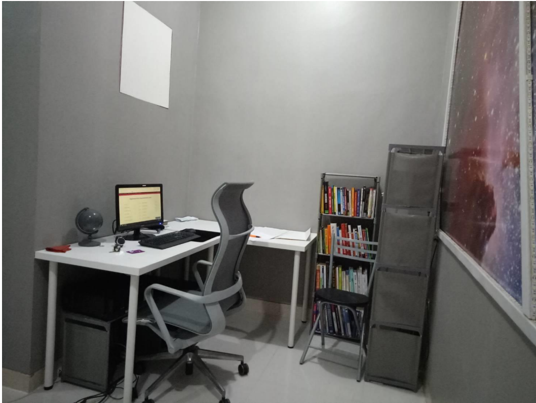
Gambar 2.2. Ruangan CEO Studio UNIXON

Pada akhirnya Pak Teru dikirim ke Hongkong dan negara-negara lain, yang akhirnya membuat Pak Teru melihat dan menyadari bahwa tidak ada produk Indonesia yang sampai ke luar negeri dan terkenal. Setelah Pak Teru melakukan penelurusan lebih jauh dengan bertanya-tanya ternyata Indonesia itu hanya menyiapkan bahan dasar saja, tetapi tidak memiliki nama. Dari itulah Pak Teru menemukan kelemahan di Indonesia, terlebih lagi Indonesia kurang pengetahuan tentang How to brand the product? Yang pada akhirnya Pak Teru berniat untuk merubah pola pikir orang Indonesia untuk mengirim barang mentah dengan memiliki nama, logo, dan kemasan yang bagus. Yang pada akhirnya terbentuklah Studio UNIXON hingga saat ini.