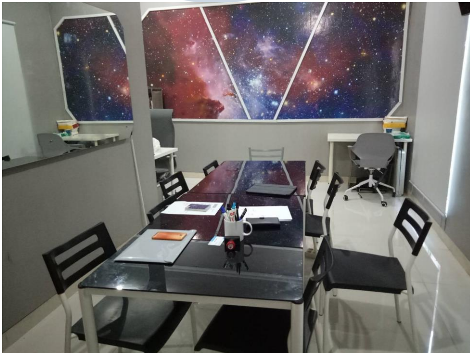
Gambar 2.1. Ruangn Studio UNIXON

Berdasarkan wawancara yang penulis lakukan kepada Bapak Theodorus Ega yang biasa dipanggil bapak Teru sebagai CEO dimana penulis mengetahui bahwa sejarah perusahaan Studio UNIXON yang beralamat di Cluster Crystal Residence Barat No. 65, Gading Serpong Tangerang, West Pakulonan, Kelapa Dua, Tangerang, Banten 15339, dengan nomor telepon 081283877659. Studio UNIXON berdiri sudah 8 tahun dari tahun 2011 yang berawal dari SMA dimulai dengan membuat sebuah website gratis untuk membantu orang, lalu makin lama ia menyadari bahwa orang banyak yang butuh website yang akhirnya terbentuklah UNIXON. Terbentuknya UNIXON sekarang yang akhirnya menjadi sebuah studio Branding karena dipilihnya Pak Teru menjadi seorang Duta Diplomasi Ekonomi yang dipilih oleh Duta Kementerian Luar Negeri.