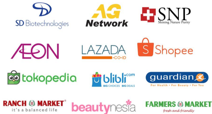
Gambar 2.2. Klien PT. Orion Beauty International

Misi dari PT. Orion Beauty International adalah SNP supplies optimal solution for healthy skin by developing safe and scientific formulas based on skin specialist experience and scientific research.