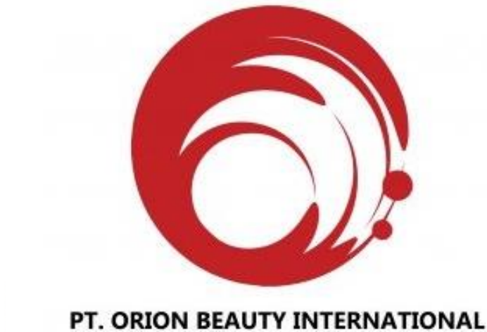
Gambar 2.1. Logo PT Orion Beauty International

Logo merupakan suatu gambaran akan citra suatu perusahaan. Makna logo PT. Orion Beauty International mengartikan sebagai identitas perusahaan yang mengemban moto “ Create Beauty & Healthy Life! ” yaitu harapan agar perusahaan menjadi penyedia produk-produk kecantikan alami dan sehat serta menjadi solusi terbaik bagi kulit orang di Indonesia.