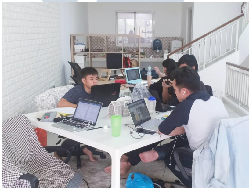
Gambar 2.1. Ruang kerja Kanoo Studio