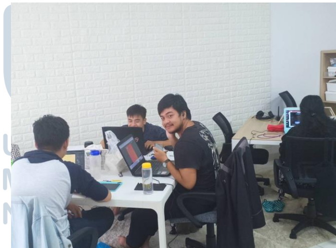
Gambar 2.3. Ruang kerja Kanoo Studio

Kanoo Studio terletak di lantai 2 Ruko Darwin No. 25, Jl. Scientia Square Barat 1, Medang, Tangerang, Banten. Di satu lantai studio terdapat bagian untuk foto dan meeting , bagian kerja, pantry , dan toilet.