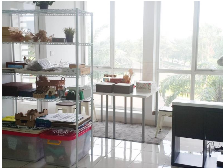
Gambar 2.2. Bagian untuk foto dan meeting

Kanoo Studio terletak di lantai 2 Ruko Darwin No. 25, Jl. Scientia Square Barat 1, Medang, Tangerang, Banten. Di satu lantai studio terdapat bagian untuk foto dan meeting , bagian kerja, pantry , dan toilet.