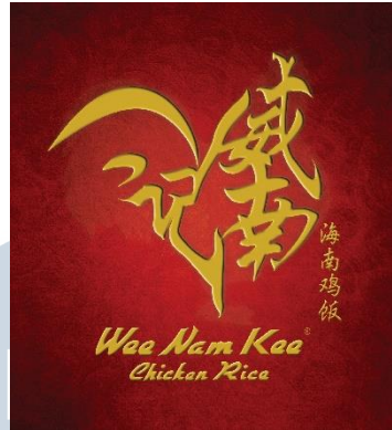
Gambar 2.5. Logo Wee Nam Kee

Sinarmas Land bekerja sama dengan salah satu Hainanese Chicken Rice yang terkenal di Asia yaitu Wee Nam Kee yang buka cabang pertama di Indonesia. Wee Nam Kee dibuka di The Breeze, Bsd City yang mengutamakan kepuasan dan gaya hidup masyarakat. Wee Nam Kee memiliki 10 cabang selain di Indonesia seperti Singapura, Filipina, Jepang, dan juga Korea Selatan. Managing Director Emerging Business Sinarmas Land mengatakan bahwa beliau memilih kuliner Wee Nam Kee karena restoran ini memiliki nilai tambah dan reputasi yang baik di dunia.