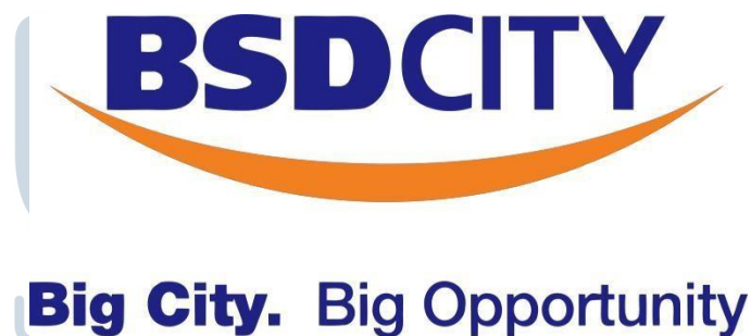
Gambar 2.3. Logo BSD City

Sinarmas Land ini terdiri dari 2 perusahaan properti yaitu PT. Bumi Serpong Damai, Tbk dan PT. Duta Pertiwi, Tbk. PT. Bumi Serpong Damai, Tbk terdapat banyak macam divisi, salah satunya adalah Emerging Business Division yang bergerak dibidang bisnis kuliner dan taman bermain. Lokasi yang dipegang oleh Emerging Business Divison antara lain BSD Xtreme Park (Arena taman bermain