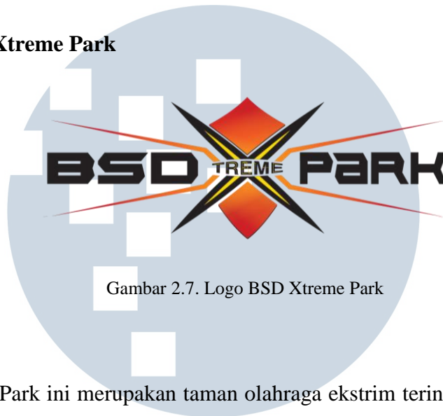
Gambar 2.7. Logo BSD Xtreme Park

BSD Xtreme Park ini merupakan taman olahraga ekstrim terintegasi pertama kali di Indonesia yang diresmikan pada tahun 2017. Luas BSD Xtreme Park ini lebih dari 5 hektar yang menawarkan beberapa jenis aktifitas luar ruang yang relevan seperti Paintball , Archery , Gokart , Rock & Rope , Skate Park , dan Bike Park . Tempat ini didedikasikan kepada orang-orang yang menyukai tantangan dan ingin bersenang-senang.