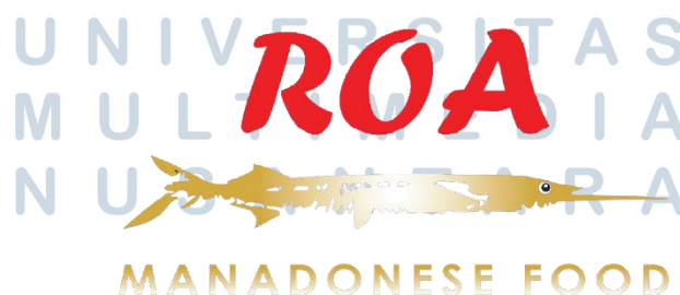
Gambar 2.6. Logo ROA Manadonese