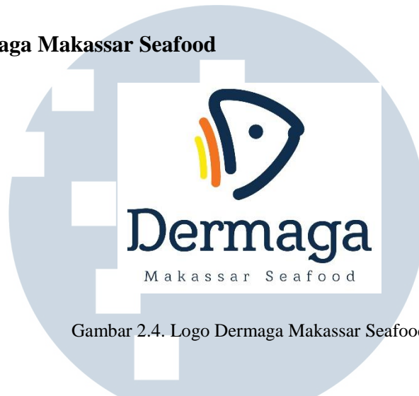
Gambar 2.4. Logo Dermaga Makassar Seafood

Dermaga Makassar Seafood ini merupakan salah satu restoran yang berlokasi di The Breeze, BSD City. Pemilik Restoran, Budi Toenbolong melakukan kolaborasi dengan Sinarmas Land untuk menghadirkan masakan aneka hidangan laut. Awalnya restoran ini dibuka di Surabaya, kemudian dibuka di BSD karena BSD memiliki prospek menarik. Restoran ini dapat menampung sekitar 400-500 orang dimana dirancang dengan nuansa tradisional Makassar yang dikemas secara modern. Dermaga Makassar Seafood memiliki 2 lantai yang terdiri dari 4 ruang VIP dan juga outdoor .