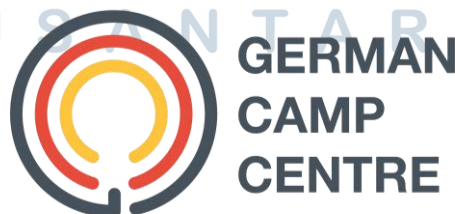
Gambar 2.1. Logo German Camp Centre

Dalam German Camp Centre. (n.d.) Retrieved May 20, April, from https://www.germancampcentre.com/ GCC merupakan sebuah wadah pelatihan dan persiapan bagi siswa/i yang berencana untuk melanjutkan pendidikan ke jenjang berikutnya di Jerman dengan mengutamakan pengembangan Hardskill dan Softskill .