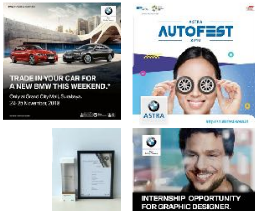
Gambar 2.4. Contoh Desain yang Dibuat Sebelum Penulis Masuk

Dibawah ini penulis akan menjabarkan sedikit dari media promosi yang sudah dikerjakan oleh karyawan magang pada periode sebelum penulis memasuki masa magangnya di PT BMW Astra.