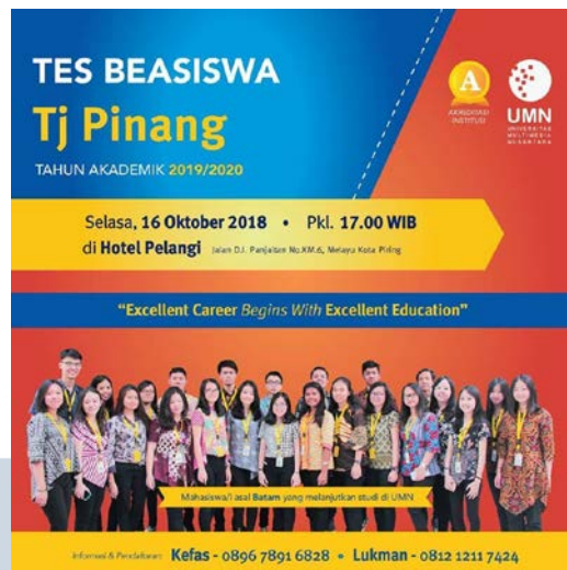
Gambar 2.3 Desain Poster informasi Pendaftaran Tes Beasiswa

Untuk menunjang kegiatan promosi untuk para calon civitas akademis, Department Marketing and Promotion Divisi Kreatif Universitas Multimedia Nusantara merancang sebuah desain poster untuk memberikan informasi penyelenggaraan test kegiatan beasiswa di Universitas Multimedia Nusantara. Desain yang telah dirancang kemudian akan di publikasikan ke khalayak umum seperti ke berbagai sekolah-sekolah menengah atas dan juga berbagai platform daring yang dimiliki Universitas Multimedia Nusantara.