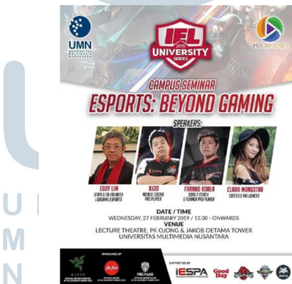
Gambar 2.6 Desain Poster Informasi Penyelenggaraan Esport: Beyond Gaming 2018

Department Marketing and Promotion juga menerima sebuah tugas untuk merancang sebuah desain poster dari Divisi lainnya yang akan menyelenggarakan kegiatan acara di kampus Universitas Multimedia Nusantara.