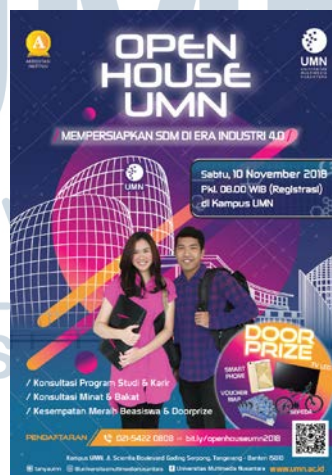
Gambar 2.4 Desain Poster Informasi Penyelenggaraan Open House 2018

Untuk menunjang kegiatan promosi untuk para calon civitas akademis, Department Marketing and Promotion Divisi Kreatif Universitas Multimedia Nusantara merancang sebuah desain poster untuk memberikan informasi penyelenggaraan test kegiatan beasiswa di Universitas Multimedia Nusantara. Desain yang telah dirancang kemudian akan di publikasikan ke khalayak umum seperti ke berbagai sekolah-sekolah menengah atas dan juga berbagai platform daring yang dimiliki Universitas Multimedia Nusantara.