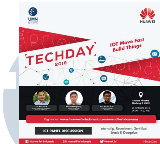
Gambar 2.5 Desain Poster Informasi Penyelenggaraan TECHDAY 2018

memberikan sebuah perkenalan kampus kepada khalayak umum terutama para orang tua yang ingin mengetahui lebih dalam mengenai lingkungan dan fasilitas yang dimiliki oleh Universitas Multimedia Nusantara.