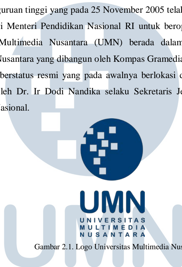
Gambar 2.1. Logo Universitas Multimedia Nusantara.