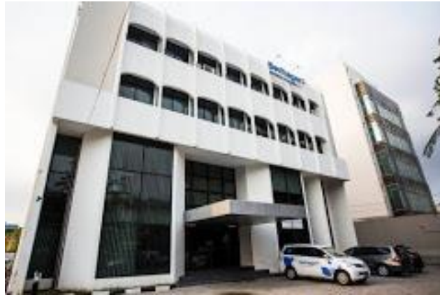
Gambar 2.1. Gedung Perusahaan

Situs berita Beritagar.id digagas oleh lebih dari 300 media daring (dalam jaringan) berbahasa Indonesia yang menerbitkan berita setiap harinya, bahkan diantara sampai 24 jam. Maka dari itu, Beritagar.id melakukan agregasi, yang berarti mengumpulkan benda yang terpisah menjadi satu. Bukan berarti Beritagar.id sekadar membuat daftar tautan, tetapi menyunting dan membuat konten berita dan menyampaikannya kembali kepada masyarakat. Untuk melakukan agregasi, Beritagar.id menggunakan computer-assisted reporting , yaitu teknologi pelaporan dalam pembuatan konten Beritagar.id yang dikembangkan oleh Rekanalar melalui ilmuwan bernama Jim Geovedi, Direktur Machine Learning (ML) dan Natural Language Processing (NLP) yang merupakan bidang ilmu komputer dan berhubungan dengan kecerdasan buatan dan komputasi linguistik. Mesin Rekanalar juga mampu menyaring iklan yang relevan dengan pembaca sehingga pembaca tidak merasa terganggu dengan keberadaannya. Teknologi inilah yang membantu Beritagar.id dalam mengumpulkan, menyaring, menganalisis media daring yang bertebaran dan menceritakan kembali kepada masyarakat.