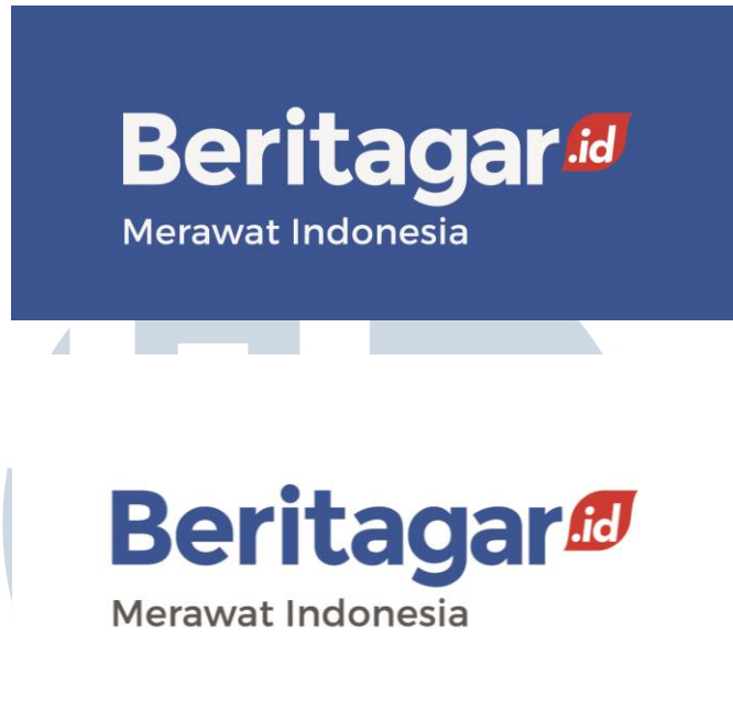
Gambar 2.2. Logotype Perusahaan

Logo Beritagar.id merupakan logotype dengan latar belakang berwarna putih dan berwarna biru sehingga dapat digunakan sesuai kebutuhan. Terdapat tagline pada logo yang bertuliskan “Merawat Indonesia” dimana tagline ini merupakan visi dari Beritagar.id.