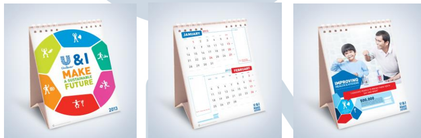
Gambar 2.5. Unilever

Unilever merupakan suatu perusahaan yang bergerak dalam pemasaran dan distribusi, menyediakan produk-produk yang sudah memiliki beberapa brand ternama dalam hal kebutuhan sehari-hari yang dikenal oleh kalangan masyarakat.