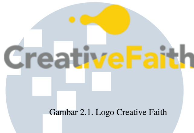
Gambar 2.1. Logo Creative Faith

Creative Faith atau PT. Manna Faith Intenational merupakan perusahaan yang bergerak dalam bidang kreatif dan mempunyai tujuan mengkomunikasikan target dengan brand. Sebagai partner komunikasi yang berintegrasi, Creative Faith juga membangun kemitraan untuk membuat sesuatu pesan yang kuat dan efektif dalam suatu perusahaan brand. Visi dari perusahaan tersebut ialah mitra yang diakui dan dipercaya secara internasional sebagai perusahaan komunikasi terintegrasi dengan mendukung perkembangan dan kemajuan terhadap brand. Misi dari agensi tersebut adalah membangun hubungan dengan para klien dengan memberikan layanan yang berdasarkan dengan pengetahuan atau kebutuhan strategi bisnis dalam jangka panjang.