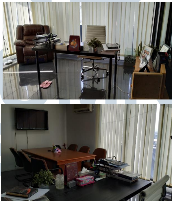
Gambar 2.2. Ruang Kerja CEO Creative Faith

Untuk lokasi kantor Creative Faith berada di Jl. Sulaiman no 32, Kebon Jeruk, Jakarta Barat.