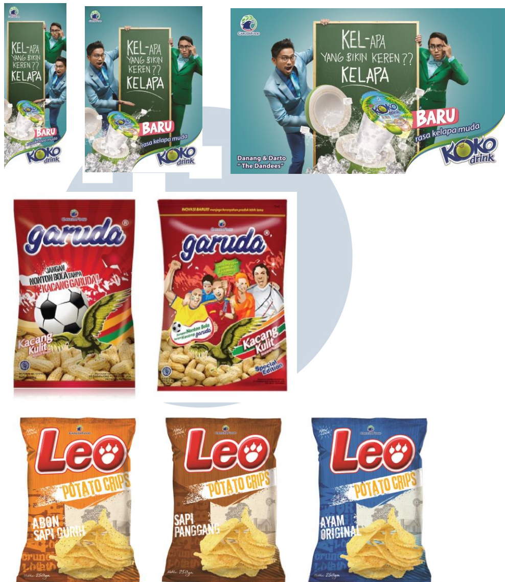
Gambar 2.6. Garuda Food

Berikut portofolio di atas merupakan desain kampanye dan desain kemasan dari Creative Faith untuk PT. Garuda Food yang merupakan perusahaan yang memproduksi produk makanan dan minuman lokal dengan adanya beberapa nama brand yang sudah dikenal oleh masyarakat.