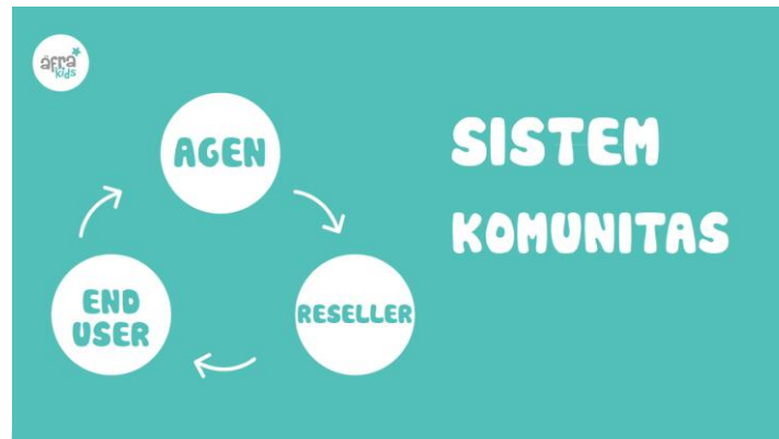
Gambar 2.1.1. Ilustrasi Sistem Komunitas Perusahaan

Untuk mencapai semua misi tersebut, dalam penjualan produk Afrakids menciptakan sebuah sistem komunitas bagi masyarakat luas: