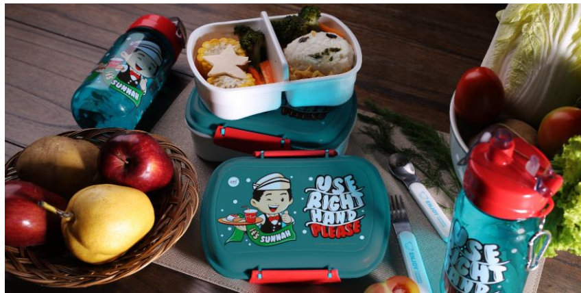
Gambar 2.5. Portofolio Lunch Set Afrakids

Lunch set atau biasa di sebut paket makan siang dari Afrakids ini memiliki ilustrasi yang menarik dan teks yang mendidik dengan cara islami.