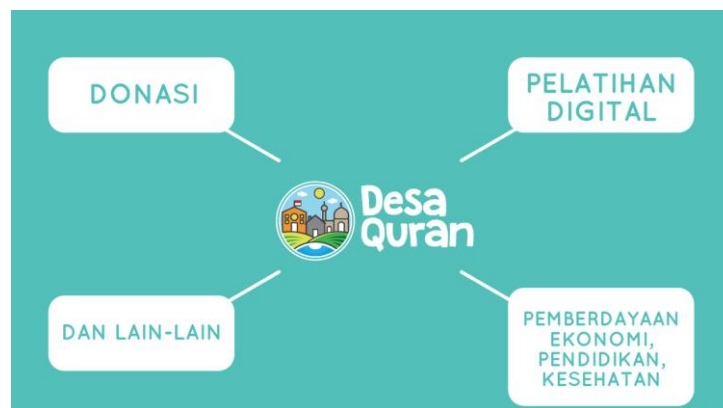
Gambar 2.1.2. Ilustrasi Proyek Sosial Perusahaan

Profit yang dihasilkan dari sistem itu sebagiannya disalurkan ke proyek sosial yang bernama Desa Quran. Desa Quran adalah sebuah gerakan masyarakat yang berfokus pada pembangunan dan pembinaan desa-desa di Indonesia.