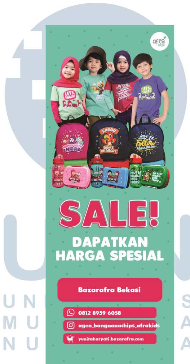
Gambar 2.3. Portofolio X-Banner Afrakids

X-banner (Ukuran 60×160 cm) adalah salah satu media yang digunakan Afrakids untuk menyampaikan informasi, dibawah ini adalah salah satu desain x-banner yang dibuat Afrakids untuk menyampaikan informasi adanya bazaar Afrakids di bekasi.