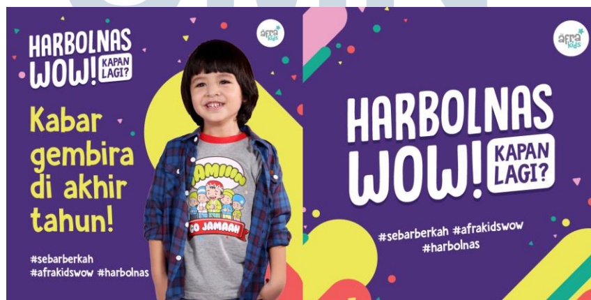
Gambar 2.6. Portofolio Poster Harbolnas 2017 Afrakids

Poster merupakan salah satu strategi promosi yang cukup ampuh untuk menyampaikan informasi, Afrakids membuar poster promosi Harbolnas 2017 dengan desain yang kiddist dan colourful untuk di posting di media sosial Instagram yang berukuran square (1080x1080 pixels ).