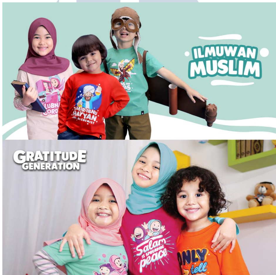
Gambar 2.2. Portofolio Kaos Afrakids

Kaos dari Afrakids yang berkonsep islami dengan warna yang colourful dan ilustrasi yang mendidik dengan adanya gambar dan teks menjadi produk andalan PT. Afra Insan Amanah.