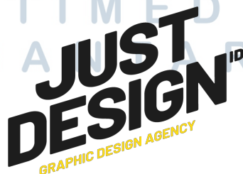
Gambar 2.1. Logo Just Design Indonesia