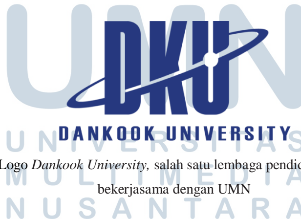
Gambar 2.2. Logo Dankook University , salah satu lembaga pendidikan luar negeri yang bekerjasama dengan UMN

CED UMN telah bekerjasama dengan banyak lembaga pendidikan luar negeri dan institusi. Salah satu program CED UMN adalah memiliki program belajar bahasa Korea yang merupakan program kerjasama UMN dengan Dankook University dari Korea Selatan. Keunggulan proses belajar di sini yaitu menggunakan buku yang didatangkan langsung dari Dankook University dan dibimbing langsung oleh pengajar native speaker dari Korea Selatan dengan latar belakang pendidikan Korean Language Education , sehingga bagi mereka yang ingin belajar Bahasa Korea mendapatkan benefit yang maksimal.