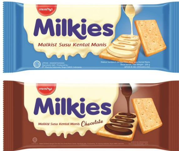
Gambar 2.3. Varian rasa Milkies (Data Internal PT Bright Foods International)