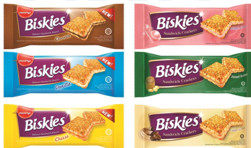
Gambar 2.2. Varian rasa Biskies (Data Internal PT Bright Foods International)

PT Bright Foods International membawahi dua brand biskuit, yaitu Biskies dan Milkies, yang dipasarkan seluruh Indonesia. Sampai saat ini, Biskies merupakan sandwich crackers yang tersedia dalam enam varian rasa dan tiga varian berat. Varian rasa dari Biskies adalah Chocolate, Vanilla, Cheese, Bubble Gum, Peanut Butter, dan Coffee Eclair dan varian beratnya adalah 18 gram, 36 gram, dan 108 gram. Milkies merupakan milkist sandwich dengan krim rasa susu kental manis. Sedangkan Milkies terdiri dari dua varian rasa dan berat. Varian rasa dari Milkies adalah Vanilla dan Chocolate dengan varian berat 20 gram dan 110 gram.