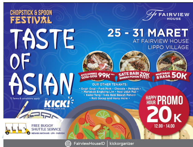
Gambar 3.12. Desain Final Spanduk Taste of Asian