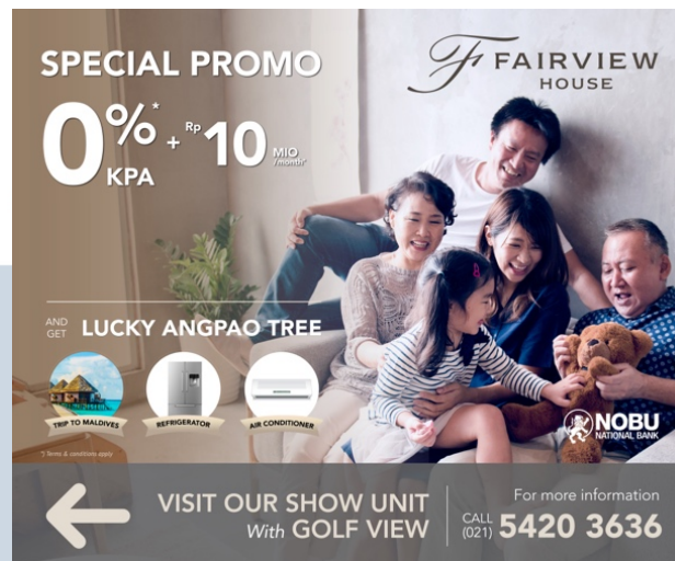
Gambar 3.4. Desain Final Spanduk Fairview

cukup besar yaitu 4x5 m, penulis dibantu dan diberitahu oleh karyawan lain bagaimana cara save desain tersebut sesuai dengan ukuran yang diminta.