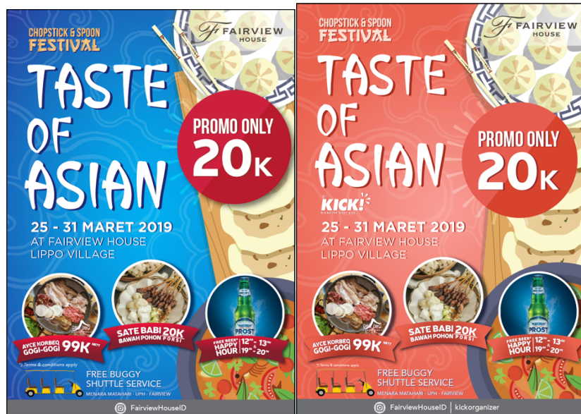
Gambar 3.10. Alternatif Master Design Taste of Asian 1

bentuk kotak terkesan kaku sehingga penulis memutuskan untuk menggunakan bentuk yang bulat agar terkesan lebih dinamis.