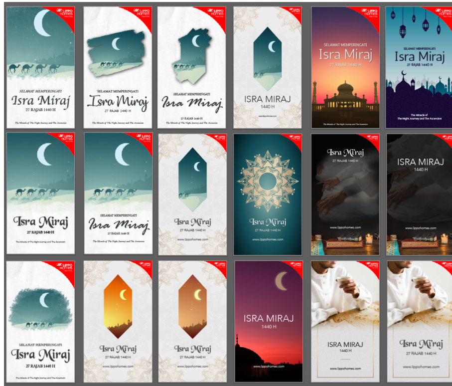
Gambar 3.15. Alternatif greetings Isra Miraj

perubahan background dan font dengan menggunakan vector yang telah dibuat oleh penulis.