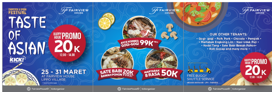
Gambar 3.14. Desain Final Instagram Taste of Asian