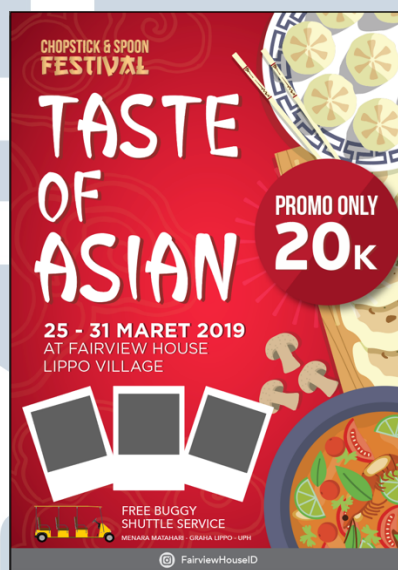
Gambar 3.9. Alternatif Master Design Taste of Asian

warna merah. Selain itu warna merah juga merupakan warna yang dapat meningkatkan nafsu makan berdasarkan teori yang pernah penulis baca. Penulis juga menggunakan font yang cenderung lebih asian . Setelah itu penulis melakukan asistensi kepada Veronica Marianne dan dilanjutkan ke Marvin. Karena informasi pada master design belum fix , penulis masih membuatnya dalam bentuk seperti draft .