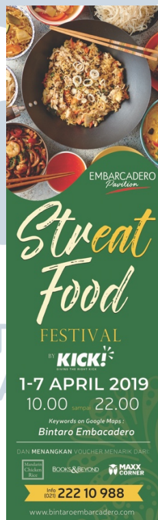
Gambar 3.6. Desain Final Umbul-umbul Street Food