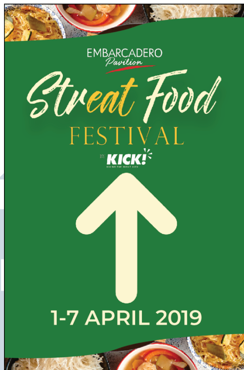
Gambar 3.8. Desain Final Signage Street Food