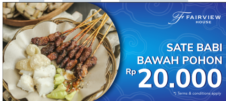
Gambar 3.15. Desain Final Voucher Taste of Asian