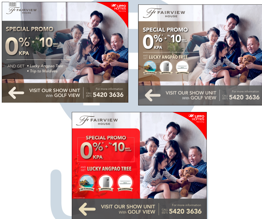
Gambar 3.3. Alternatif Desain Spanduk Fairview

dalam spanduk tersebut. Ada beberapa alternatif warna yang digunakan berdasarkan color palette yang ada di brosur-brosur Fairview sebelumnya dan juga menggunakan warna merah sesuai dengan promo yang sedang berjalan yaitu Lucky Angpao .