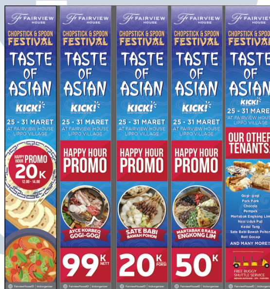
Gambar 3.13. Desain Final Umbul-umbul Taste of Asian