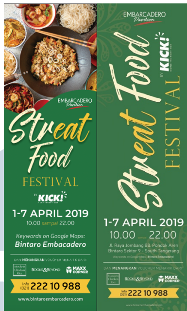
Gambar 3.5. Alternatif Desain Umbul-umbul Street Food