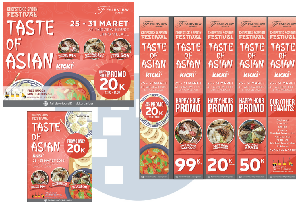
Gambar 3.11. Contoh Desain Taste of Asian

besar agar mudah dibaca ataupun font di media sosial yang nyaman dilihat dan dibaca.