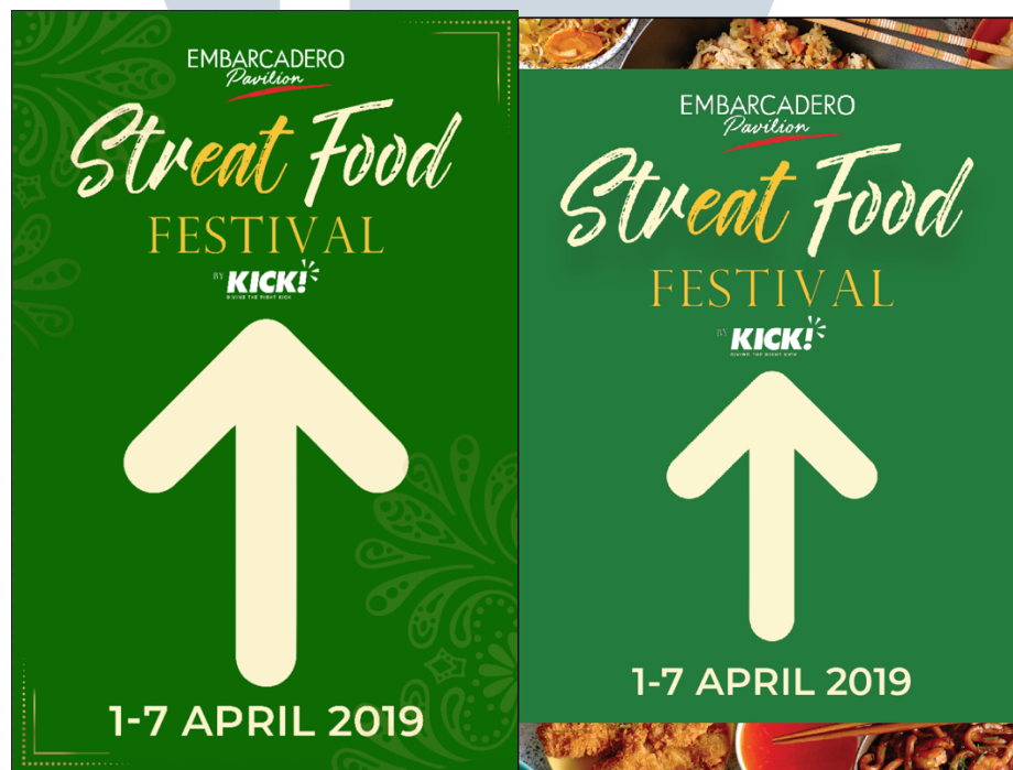
Gambar 3.7. Alternatif Desain Signage Street Food

Selain membuat umbul-umbul, penulis juga membuat signage yang akan digunakan di jalan agar orang-orang tahu letak lokasi event . Penulis membuat beberapa alternatif dan melakukan asistensi kepada Lissa. Untuk pembuatan signage ini, penulis melakukan asistensi dari via whatsapp karena pada saat itu Lissa tidak masuk. Saat melakukan asistensi, Lissa meminta agar bentuk dari panah tersebut dibuat rounded dan juga ukuran tulisan yang memudahkan orang-orang yang melihatnya. Setelah melakukan revisi, penulis diminta juga untuk resize ukuran brosur sesuai dengan yang diminta oleh senior.