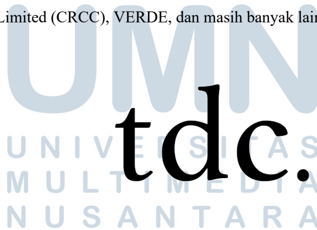
Gambar 2.1. Logo TDC Indonesia

TDC Indonesia memiliki beberapa klien yang sudah diajak bekerja sama dan masih berjalan sampai dengan sekarang yaitu, seperti: Artha Graha Grup, PT. Jakarta Setiabudi Internasional, Daan Mogot City, China Railway Construction Corporation Limited (CRCC), VERDE, dan masih banyak lainnya.