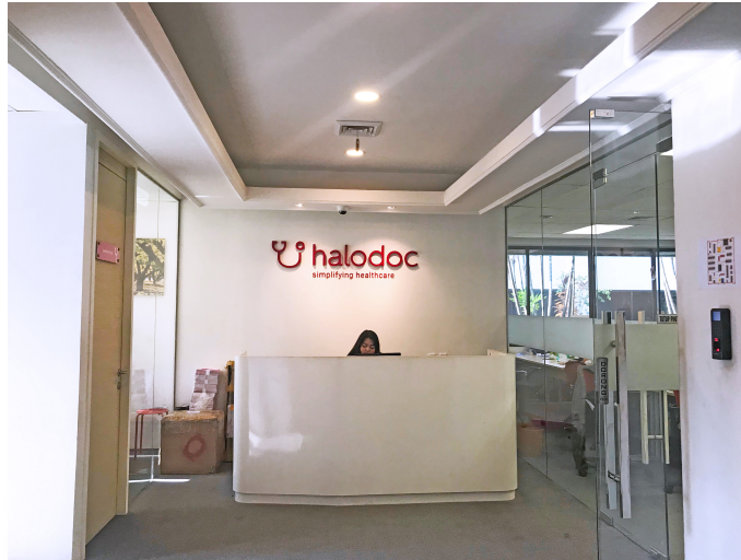
Gambar 2.2. Lobby PT. Halodoc.

PT. Halodoc terletak di Gedung Mensa 2, Jalan H.R. Rasuna Said Kav B34, Karet, Kuningan, Karet, Jakarta. PT. Halodoc terdiri dari 4 lantai, untuk Lobby Halodoc, IT, product , finance , ruangan CEO berada di lantai 4, untuk lantai 3 berisi ruangan human capital , customer services , sedangkan lantai 2 adalah tempat saya bekerja yaitu ruangan divisi marketing .