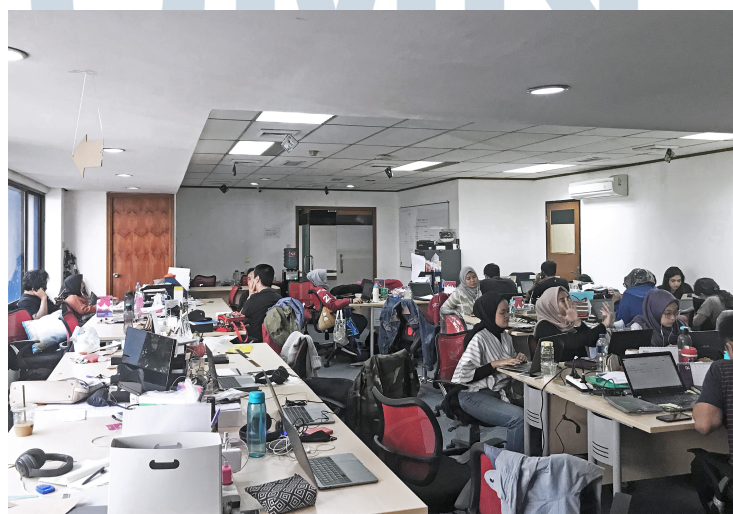
Gambar 2.3. Ruang Kerja Tim Marketing

PT. Halodoc terletak di Gedung Mensa 2, Jalan H.R. Rasuna Said Kav B34, Karet, Kuningan, Karet, Jakarta. PT. Halodoc terdiri dari 4 lantai, untuk Lobby Halodoc, IT, product , finance , ruangan CEO berada di lantai 4, untuk lantai 3 berisi ruangan human capital , customer services , sedangkan lantai 2 adalah tempat saya bekerja yaitu ruangan divisi marketing .