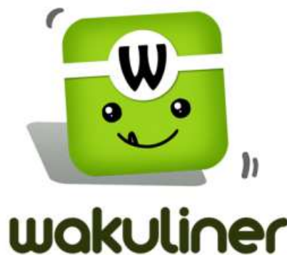
Gambar 2.2 Logo Wakuliner