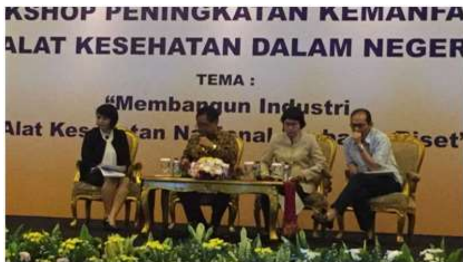
Gambar 2.6 Suasana Acara PT Indo Media Utama

Perusahaan ini membutuhkan hal serupa yaitu katering dari Wakuliner pada 19 Maret 2018 untuk acara “Manfaat Alat Kesehatan Dalam Negeri”.