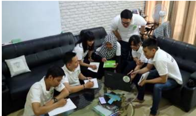
Gambar 2.1 Wakuliner Home Office