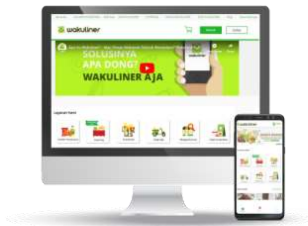
Gambar 2.3 Website dan Mobile App