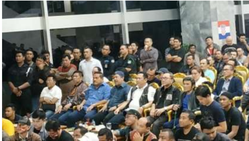
Gambar 2.5 Suasana Acara Nobar Piala Dunia