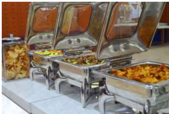
Gambar 2.4 Suasana Acara KEMENDIKBUD