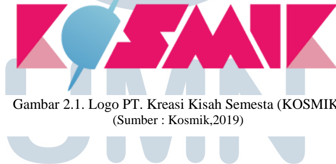
Gambar 2.1. Logo PT. Kreasi Kisah Semesta (KOSMIK)

KOSMIK merupakan perusahaan management dan produksi IP komik Indonesia yang didirikan oleh Sunny Gho dan muncul ke publik pada tahun 2015. KOSMIK sendiri memiliki visi misi untuk menciptakan komik Indonesia yang mampu bersaing secara komersial dan membawa nilai kultural sehingga komik bisa menjadi pilar kuat untuk ekonomi kreatif Indonesia. Berdasarkan visi misi di atas, KOSMIK memiliki visi misi yaitu untuk menciptakan IP komik di Indonesia yang bisa menjadi sesuatu yang diingat dan juga memiliki kualitas yang sangat tinggi. Visi misi KOSMIK yang ambisius ini dijalankan dengan baik sampai saat ini dengan selalu membuktikan diri dengan menciptakan IP komik yang memiliki kualitas hebat.