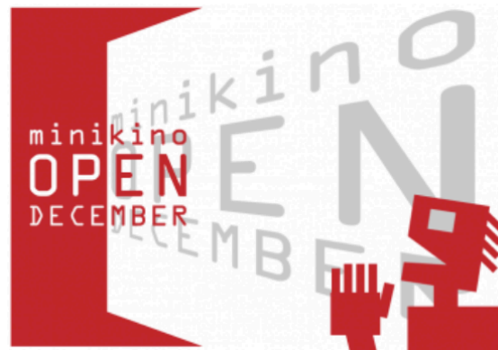
Gambar 2.1. Logo Open December

Program Open December berjalan hampir bersamaan dengan S-Express di tahun 2003. Program ini menjadi sangat menarik karena film yang diputar adalah film dengan durasi terpendek dan pembuat filmnya harus hadir di pemutaran tersebut. Hal ini menjadi salah satu ajang pendekatan dengan pembuat film lokal yang ada disekitar. Walaupun beberapa tahun belakangan ini ada beberapa pembuat film dari luar kota bahkan luar negeri yang ikut datang untuk meramaikan acara Open December ini. Seperti namanya, Open December selalu diadakan di bulan Desember sebagai ajang tutup tahun dengan tagline “tutup-tutup tahun, buka-buka film” (Prihadi, wawancara pribadi, 3 Maret 2019).