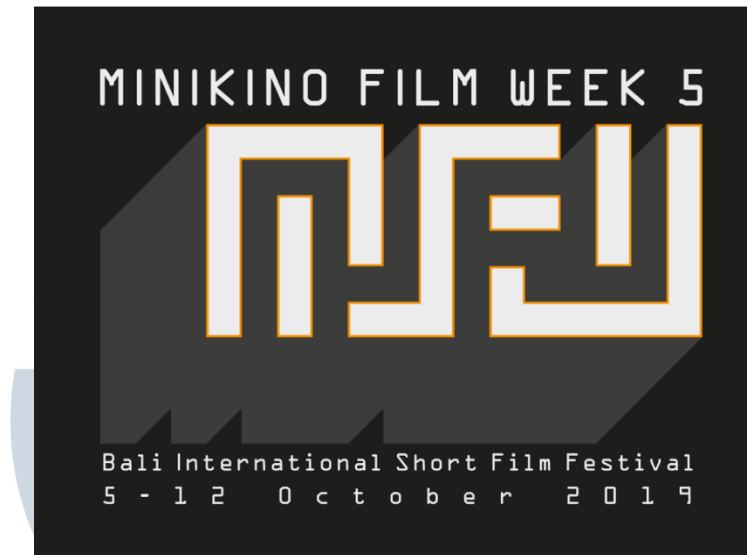
Gambar 2.2. Logo Minikino Film Week 5

paling ramah dan paling mengayomi dalam segala aspek (Prihadi, wawancara pribadi, 3 April 2019).