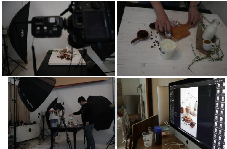
Gambar 2.3. Kegiatan kerja di Hi|Story