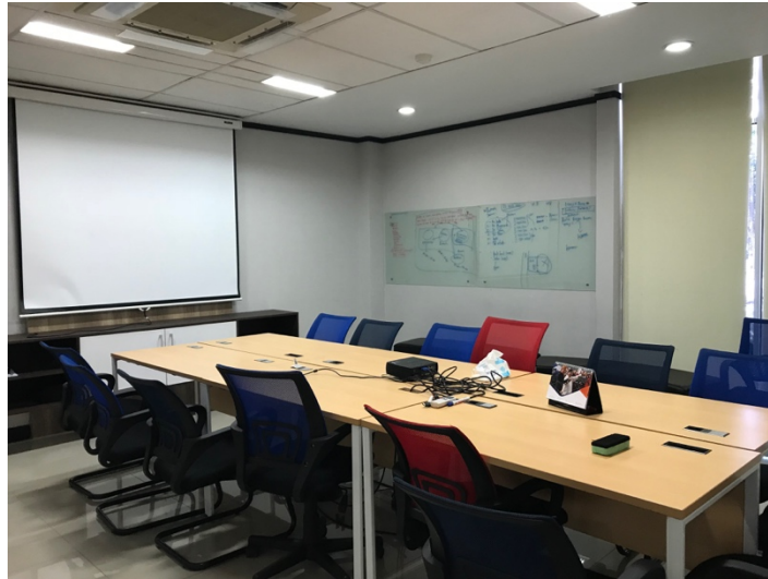
Gambar 2.5. Ruang meeting Pijaru