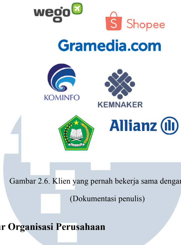
Gambar 2.6. Klien yang pernah bekerja sama dengan Pijaru (Dokumentasi penulis)