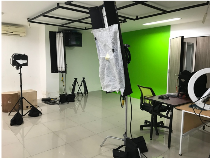
Gambar 2.3. Ruang studio Pijaru