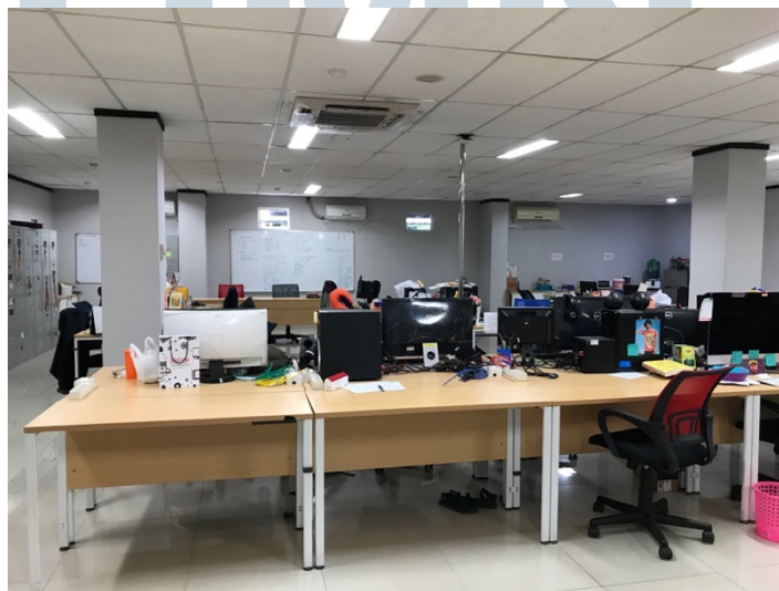
Gambar 2.2. Ruangan kerja di Pijaru

Ruangan kerja Pijaru juga cukup nyaman, dimana semua divisi berada dalam ruangan yang sama tidak dipisahkan dengan dinding maupun ruangan tertentu, hanya dipisahkan dengan meja tiap divisinya, dengan komputer dan kursi kerja yang nyaman. Pijaru juga memiliki beberapa ruangan tambahan seperti ada gudang untuk menyimpan alat, terutama alat yang jarang digunakan, kemudian ada ruangan audio dengan peredam ruangan dilengkapi dengan komputer, mic , dan kelengkapan alat sound . Kemudian ada ruang studio yang dilengkapi dengan dinding limbo putih, dan hijau untuk greenscreen , serta kelengkapan alat kamera dan lighting yang juga sudah diletakkan disitu. Dan ada juga ruang terpisah untuk general manager seorang, serta ruangan yang lebih besar yang digunakan sebagai ruang meeting yang dilengkapi dengan proyektor serta meja besar dan kursi-kursi.