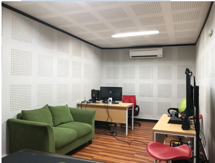
Gambar 2.4. Ruang audio Pijaru