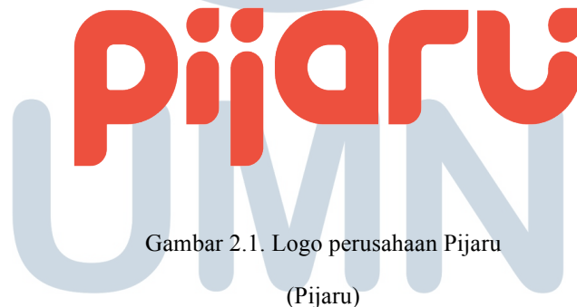
Gambar 2.1. Logo perusahaan Pijaru (Pijaru)