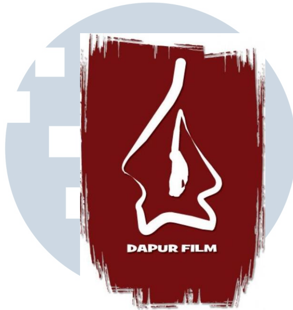
Gambar 2.1. Logo Dapur Film

( http://dapurfilmproduction.blogspot.com/ )