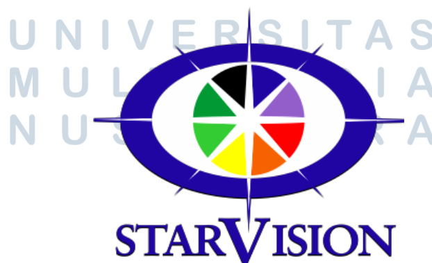
Gambar 2.1 Logo Perusahaan PT. Kharisma Starvision Plus