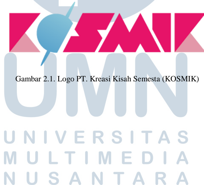
Gambar 2.1. Logo PT. Kreasi Kisah Semesta (KOSMIK)

Visi KOSMIK adalah untuk menciptakan komik Indonesia yang mampu bersaing secara komersial dan untuk membawa nilai kultural sehingga komik dapat menjadi pilar yang kuat untuk ekonomi di bidang kreatif Indonesia. Misi KOSMIK pun adalah untuk merancang dan memproduksi komik lokal yang unik, ambisius dan juga terasa personal, namun di saat yang sama sesuai dan relevan dengan target audience -nya dengan formula yang bisa terus dilakukan dan konsep yang mampu diangkat ke berbagai macam medium hiburan.