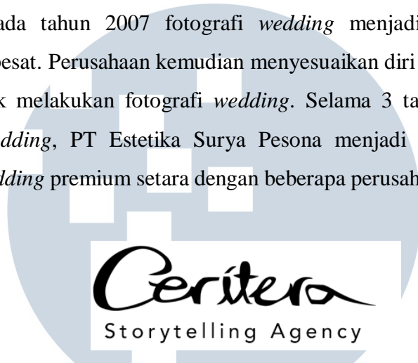
Gambar 2.1. Logo Ceritera Storytelling Agency (Dokumentasi Perusahaan)

PT Estetika Surya Pesona dibentuk tahun 2003 sebagai perusahaan fotografi komersial. Pada tahun 2007 fotografi wedding menjadi sebuah trend yang berkembang pesat. Perusahaan kemudian menyesuaikan diri dan mulai mengambil tawaran untuk melakukan fotografi wedding . Selama 3 tahun berjalan menjadi fotografer wedding , PT Estetika Surya Pesona menjadi salah satu perusahaan fotografer wedding premium setara dengan beberapa perusahaan fotografi wedding terkenal.