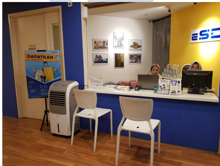
Gambar 2.3. Meja Admin ESDA (Dokumentarsi pribadi)