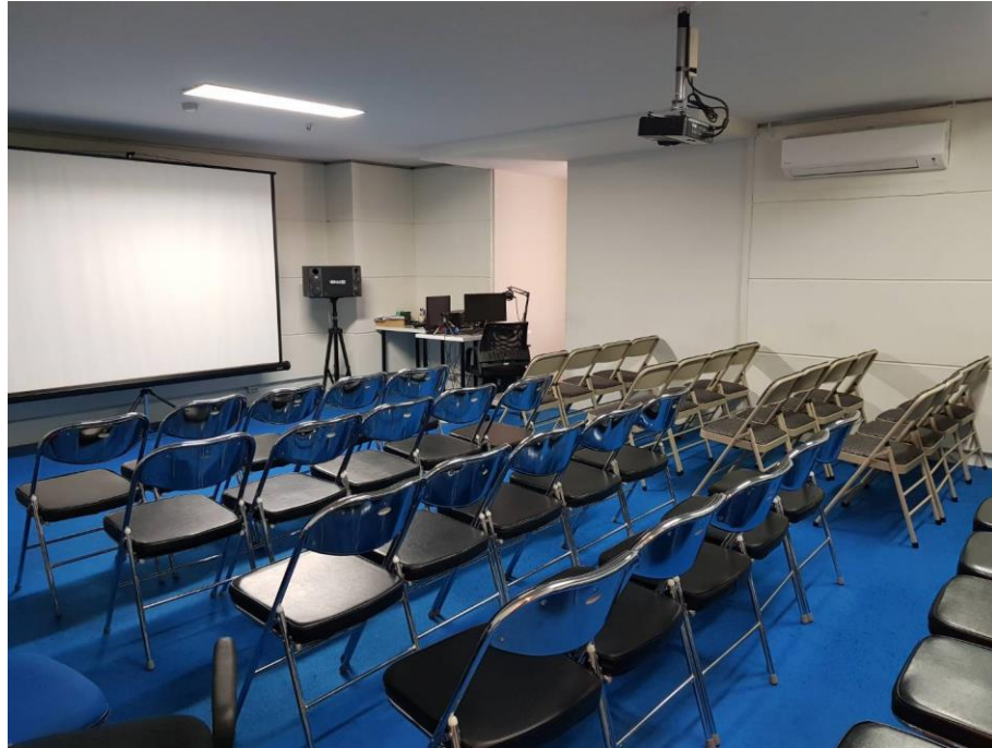
Gambar 2.6. Ruang Seminar ESDA