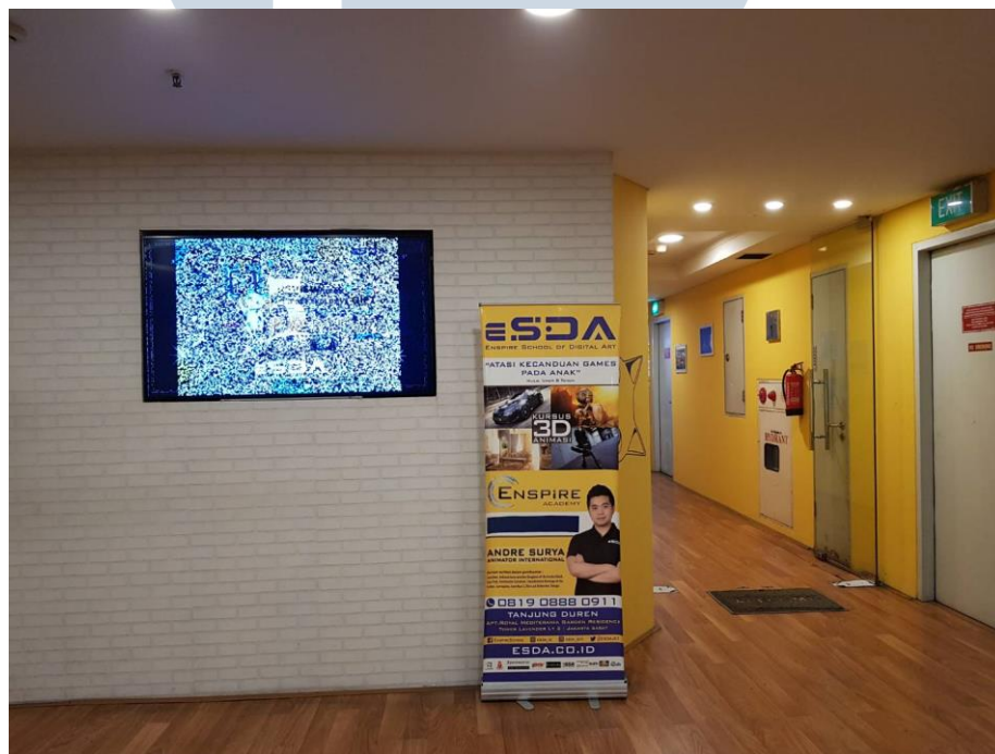
Gambar 2.1. Lobby Enspire School of Digital Art

Pada tahun 2019, Enspire School of Digital Art memiliki 35 cabang. Penulis memiliki kesempatan melakukan kerja magang di ESDA pusat yang berlokasi di Apartemen Royal Mediterania tower Lavender lantai 2, di Tanjung Duren, Jakarta Barat. Dalam satu lantai, terdiri dari ruang lounge , pantry room karyawan ESDA, ruang kelas, tempat makan umum, Studio Enspire , pantry studio , ruang kurikulum, dan ruang seminar.