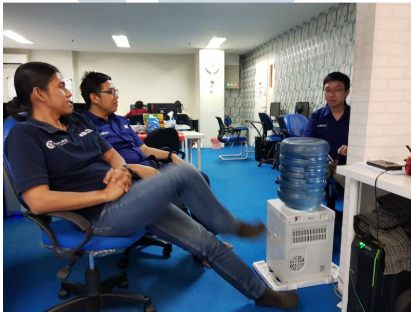
Gambar 2.5. Guru pengajar ESDA Pusat