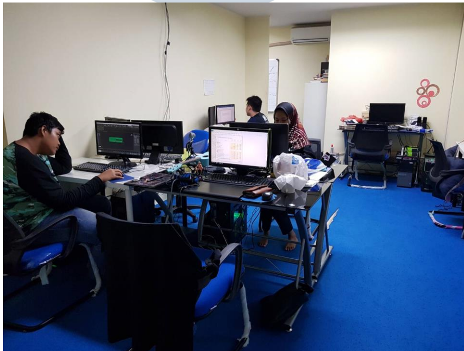
Gambar 2.7. Ruang kerja Divisi Kurikulum