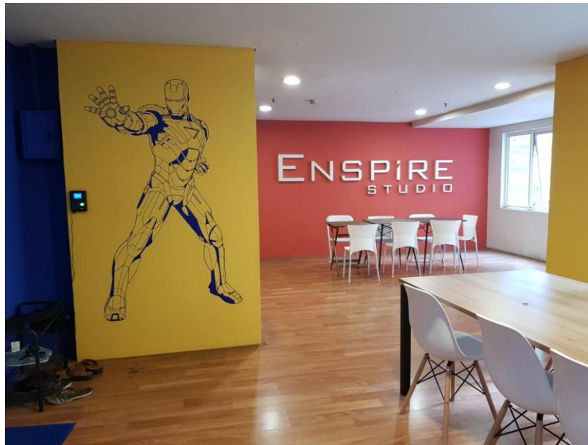
Gambar 2.2. Tempat makan bersama bagi ESDA dan Enspire Studio