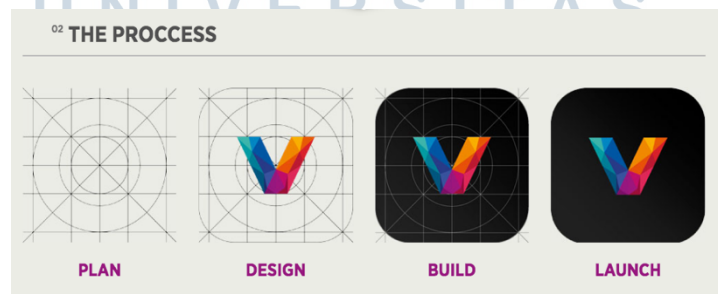
Gambar 2.2. Proses kerja Violad

Violad mempunyai tag line juga dalam melakukan pekerjaannya “ We Love What We Do ” sehingga apapun yang menjadi pekerjaan yang dilakukan dalam Violad karena didasarkan dengan kecintaan orang-orang yang bekerja dengan pekerjaan yang dilakukan. Sekalipun perbedaan karakter yang ada pada Violad namun hal tersebut yang membuat Violad menjadi unik. Perbedaan antara warna hangat dan dingin melambangkan keseimbangan yang dapat diartikan sebagai cara penyelesaian suatu masalah dengan kreatif.