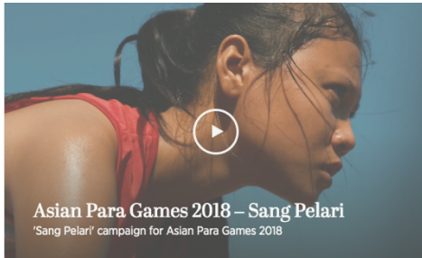
Gambar 2.4. Asian Para Games