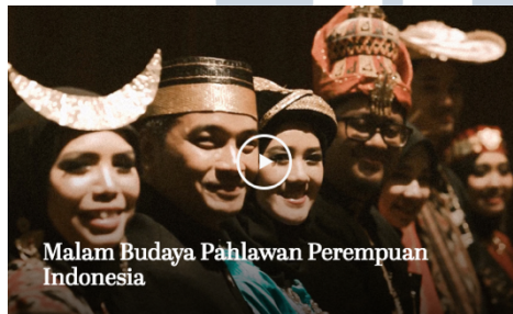
Gambar 2.6. Malam Budaya Indonesia