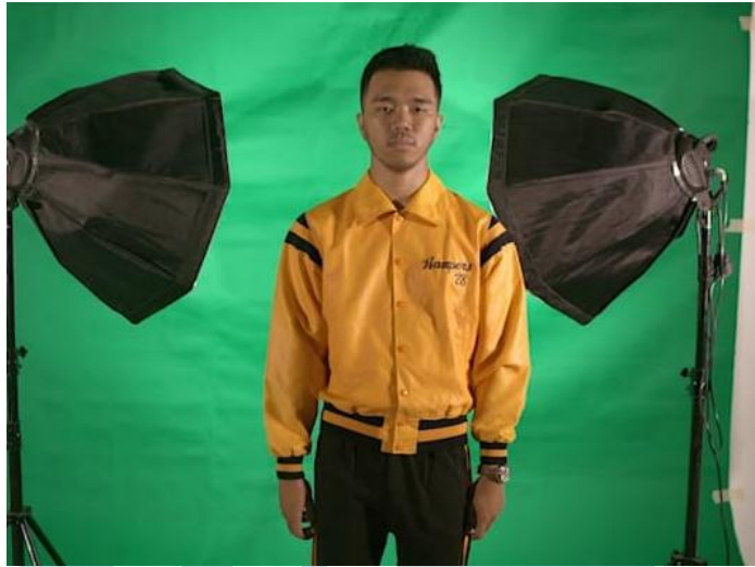
Gambar 3.2. Comedy Casting Dokumentasi Pribadi