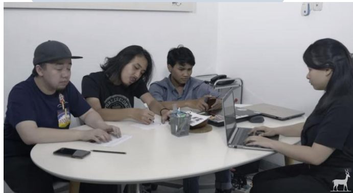
Gambar 3.3. Diary #MagangDiAntelope Angkatan 10 - Antelope Journal 42 ( https://www.youtube.com/watch?v=_9-dadREni8&t=15s , 2019)

Pada tahap produksi, peserta magang akan menjawab pertanyaan yang disiapkan teman-teman Studio Antelope secara spontan. Selanjutnya, peserta magang mengambil beberapa footage untuk video. Proses produksi dilakukan pada Rabu, 8 Mei 2019 di Studio Antelope.