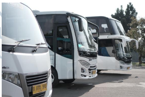
Gambar 3.4. Bus Adiputro

Pada tahap produksi, penulis bertugas untuk membagikan HT ( Handy Talky ), Nametag , dan mengumpulkannya kembali setelah shooting berakhir. Shooting project Adiputro berjalan selama dua hari pada hari Rabu dan Kamis tanggal 23 dan 24 April 2019. Shooting project Adiputro berada di dua lokasi yaitu Buperta Cibubur dan Onoma Villa di Jakarta Pusat. Penulis juga bertugas sebagai runner selama produksi untuk menyiapkan keperluan yang kurang saat produksi. Selama bertugas penulis banyak belajar dari mengamati set shooting dan sedikit mendapatkan arahan dari sutradara saat berada di lokasi.