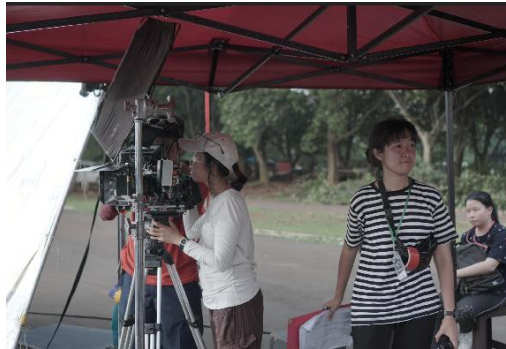
Gambar 3.5. Penulis di Project Adiputro