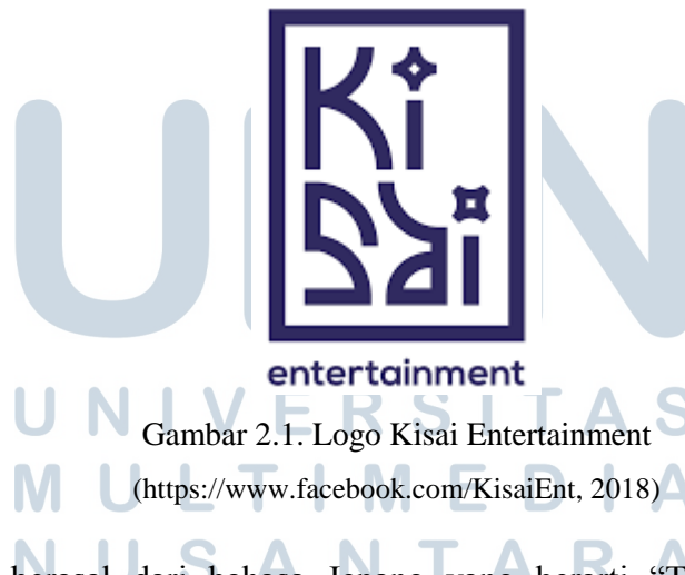
Gambar 2.1. Logo Kisai Entertainment