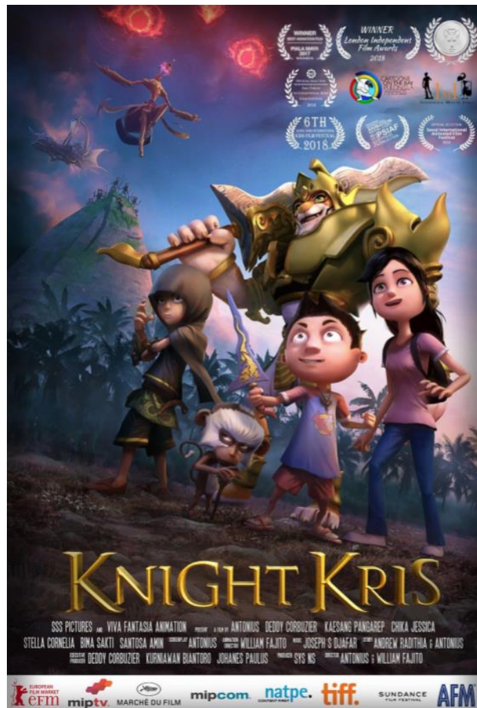
Gambar 2.2. Poster film Knight Kris.