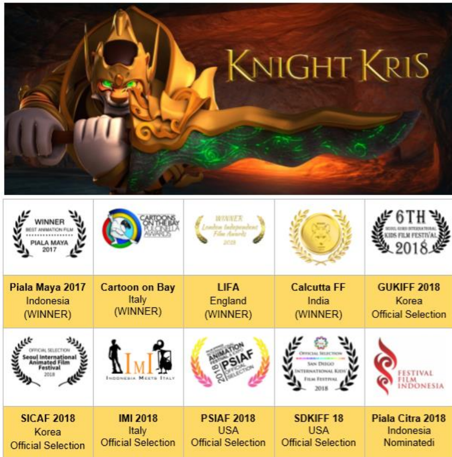
Gambar 2.3. Penghargaan yang diperoleh Knight Kris