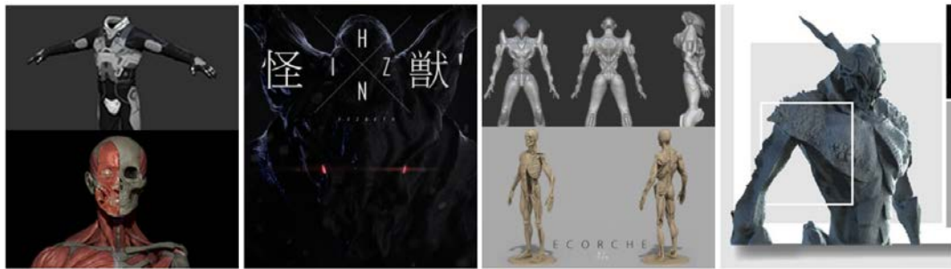
Gambar 2.3. 3D modeling Holomoc ( www.holomoc.com )