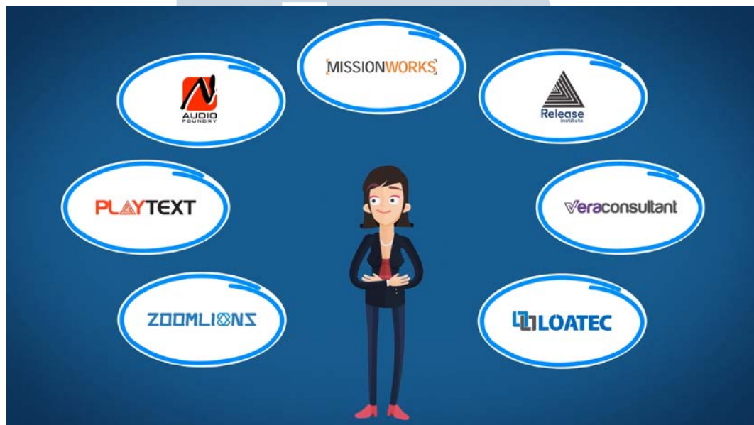
Gambar 2.4. Motion graphic Holomoc (Data Perusahaan)

Dalam websitenya Holomoc merupakan perusahaan yang bergerak di bidang industri kreatif yang di dalamnya terdapat lini jasa dan produk. Antara lain membuat 2D/3D modeling atau animasi, infografis, konten digital, augmented reality , virtual reality , mixed reality , architectural visualization , holographic , automation system .