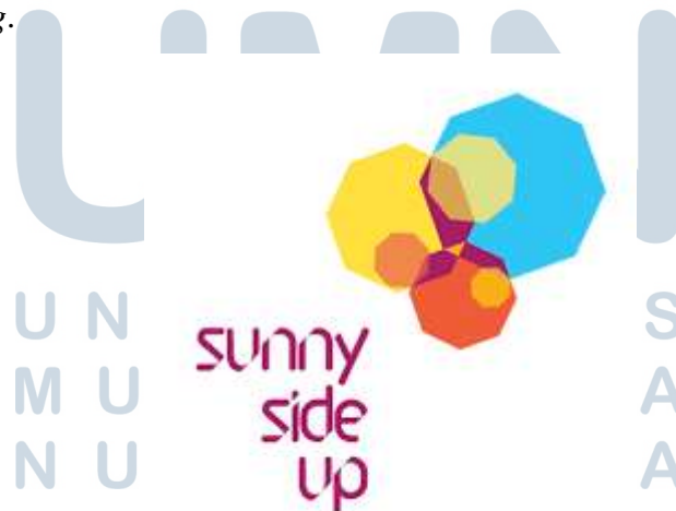
Gambar 2.1. Logo Sunny Side Up Post Production Studio

Render Post terus berkembang dan melakukan ekspansi sampai dengan tahun 2013 berganti nama menjadi Sunny Side Up Post Production Studio atau yang dikenal juga sebagai PT. Sinar Sisi Utama. Sunny Side Up Post Production Studio merupakan sebuah studio post-production iklan yang menawarkan jasa post-production dimulai dari tahap offline editing , color grading , sampai dengan online editing .