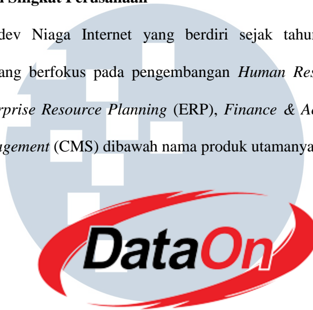
Gambar 2.1 Logo DataOn

PT Indodev Niaga Internet yang berdiri sejak tahun 1999 merupakan perusahaan yang berfokus pada pengembangan Human Resource Management (HRM), Enterprise Resource Planning (ERP), Finance & Accounting (FA), dan Content Management (CMS) dibawah nama produk utamanya yaitu SunFish.