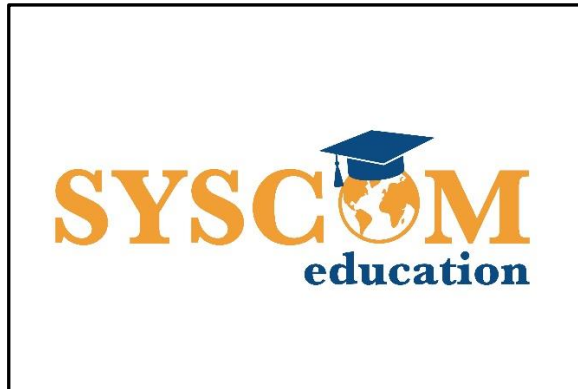
Gambar 2.1 Logo PT. Syscom Education Services