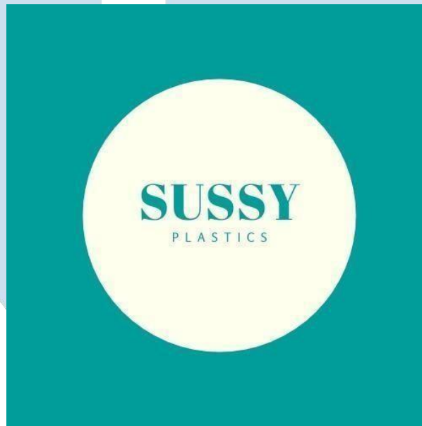
Gambar 2.1 Logo SussyPlastic Groups

SussyPlastic merupakan salah satu toko online yang berdiri pada 2020. Toko ini didirikan dikarenakan disaat pada waktu covid, banyak orang yang berada dirumah dan tidak melakukan aktivitas pekerjaan seperti biasanya. Karena hal tersebut, toko ini dibuat untuk memberikan kemudahan bagi masyarakat untuk mendapatkan produk berupa plastik, tempat makan, gelas plastik, dll.